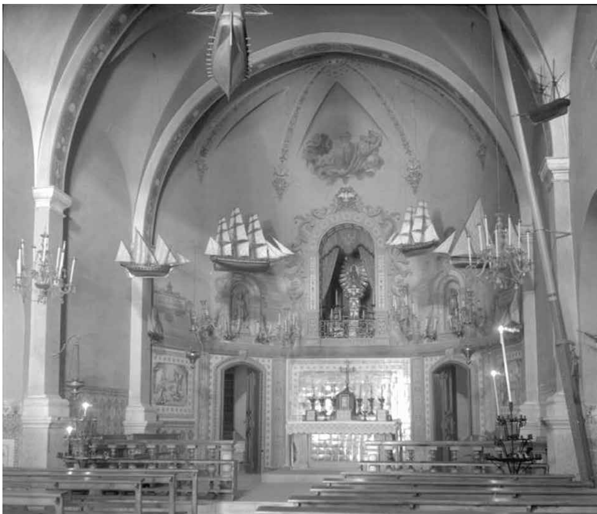
Santuari del Vilar, abans de la guerra