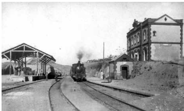
Estació del ferrocarril a Poble, entre 1910 i 1915 (AFMP 06)

es va consensuar una comissió que l'endemà a primera hora aniria amb el tren a Igualada per fer saber a les autoritats igualadines les atzagaiades que patien de l'alcalde de la Poble.