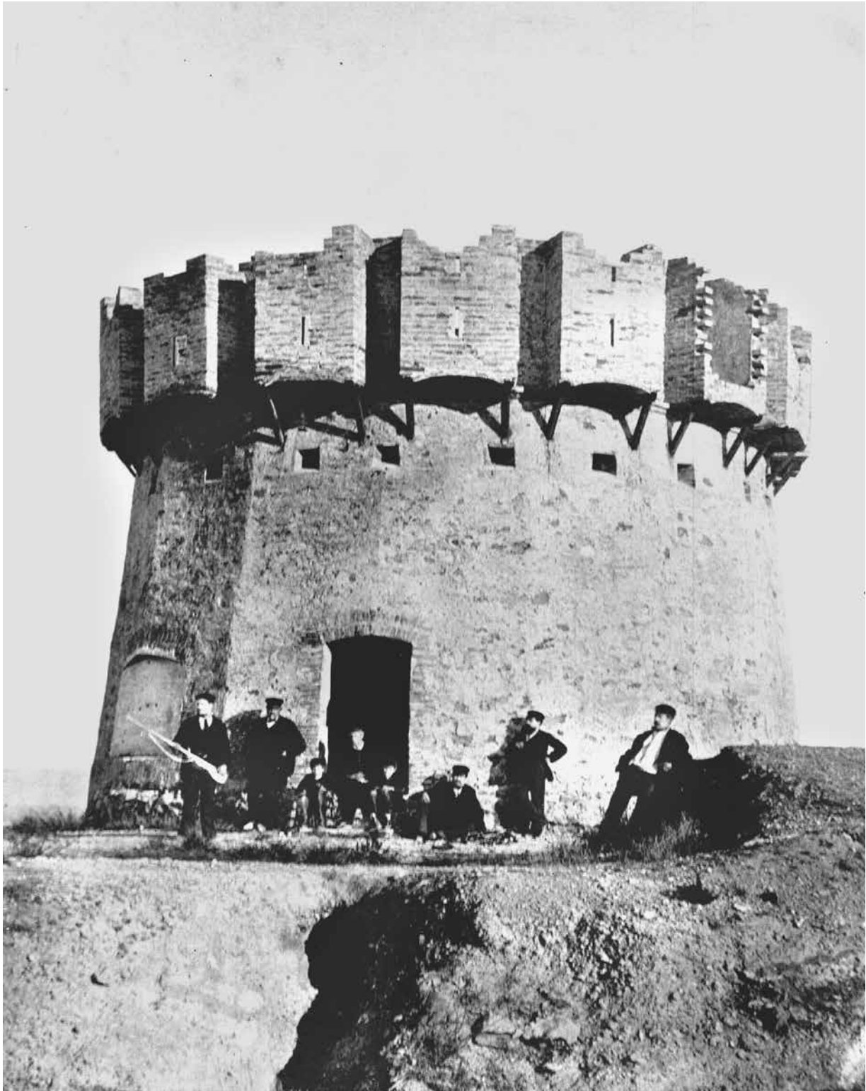
El fort del Pi, a l'inici del segle XX. Aquesta és, per ara, l'única imatge coneguda de la fortificació