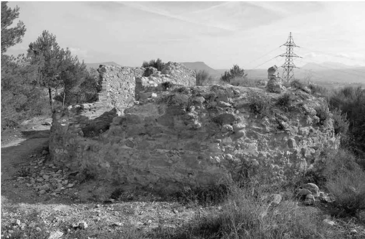
Estat actual de la torre de fuselleria

faran que ràpidament quedin absorbides pel creixement vegetal i es confonguin amb el paisatge de la carena, una circumstància, això no obstant, que ha permès mantenir-les tot i que confoses amb el paisatge natural, molt erosionades i, en molts casos, convertides en el nivell de circulació actual.