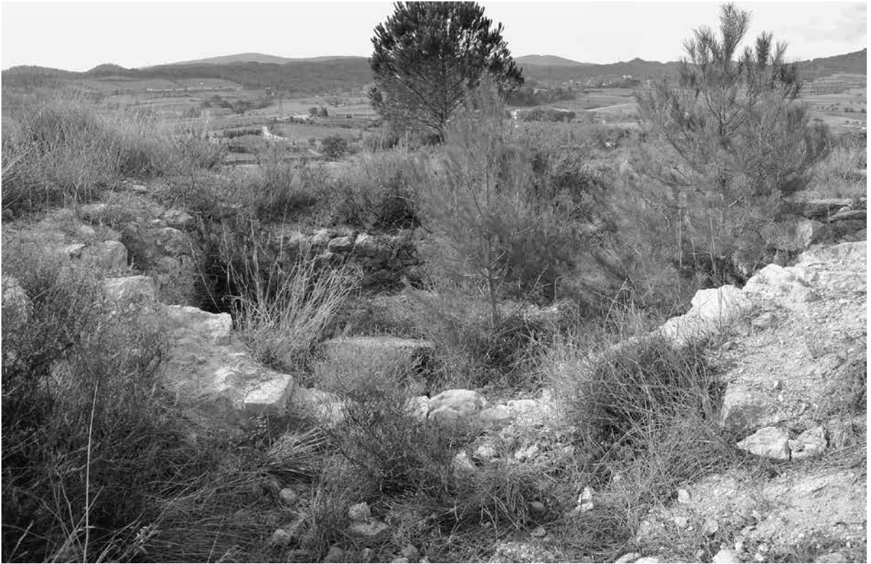
El blocaus, avui (2021)