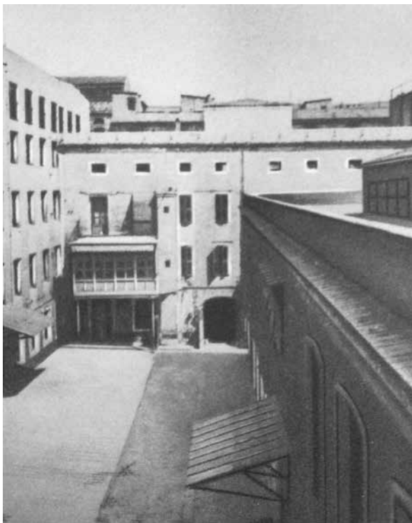
Casa-fàbrica al carrer de la Riereta

Així i tot, la iniciativa empresarial per la qual els Muntadas són més recordats és la fundació de l' España Industrial . 29 Amb seu social a Madrid en un primer moment, el 1851 és domiciliada definitivament a Barcelona. Localitzada a Sants i coneguda popularment com el Vapor Nou , 30 era una fàbrica molt moderna que comptava amb màquines de vapor importades d'Anglaterra. L'ambició i exitós projecte dels Muntadas va atreure moltes famílies igualadines que, fugint d'una punyent crisi econòmica, es van instal·lar a Sants. Es dona el cas que el que aleshores era encara una vila separada de Barcelona va veure