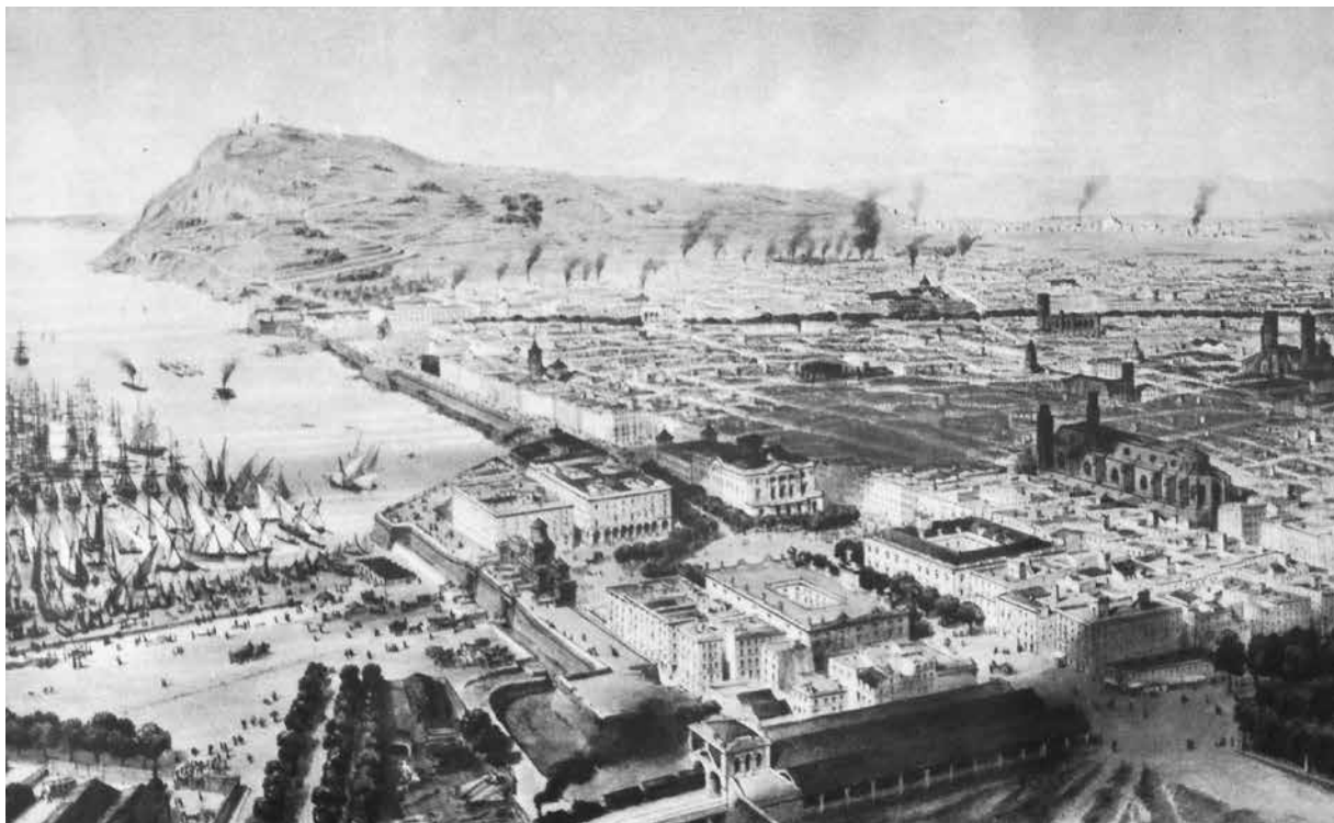
Barcelona (meitat del s. XIX). Vapors al Raval i Santa Maria de Sants

Així mateix, crec haver presentat arguments prou sòlids per defensar que Damià Campeny i Josep Campeny procedien amb tota probabilitat de dues branques d'una mateixa família, oriünda de Gualba del Vallès, i que ambdós eren plenament conscients del seu origen.