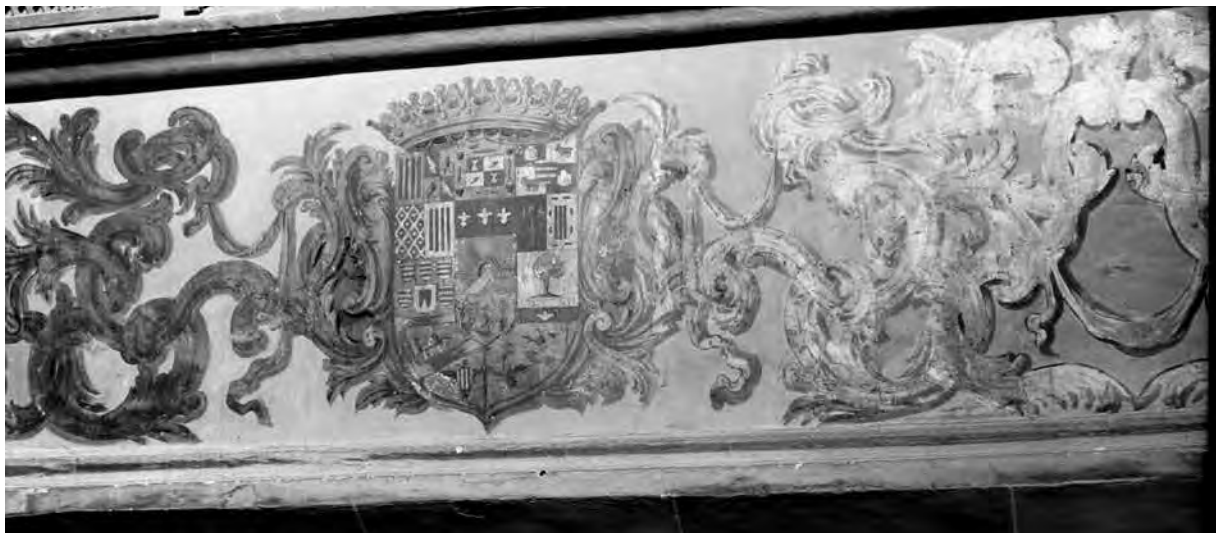
Escut dels Lanuza, senyors de Santa Margarida de Montbui i de la Quadra de Vilanova del Camí.