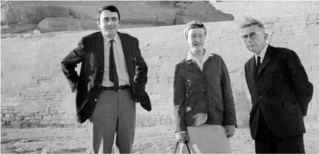
Lanzmann, Beauvoir i Sartre

tatges de temàtica molt diversa (política, cultural, etc.) també en altres publicacions com France-Observateur , Le Monde o Elle ; escrits que acabaria recopilant en un llibre i publicant sota el nom de La tombe du divin plongeur (Gallimard, 2012; en castellà el 2014 per l'editorial Confluencias, La tumba del sublime nadador ). «Jo m'he submergit al llarg de tota la meua vida dins la veritat. Les decisions que vaig prendre i que em vaig proposar acomplir van ser com profundes capbussades, vertiginosos salts al buit», deia Lanzmann al prefaci del llibre.