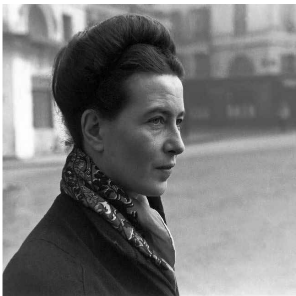
Simone de Beauvoir

Membre d'honor de la Fondation pour la Mémoire de la Shoah, 5 Lanzmann no va deixar mai d'explorar, d'indagar pacientment però amb fermesa en l'abisme on van sucumbir sis milions de persones. Aquesta era la seva tasca, deia: «La tasca de desxifrar el món, que no hauríem d'abandonar mai, comporta compromís i resistència». 6