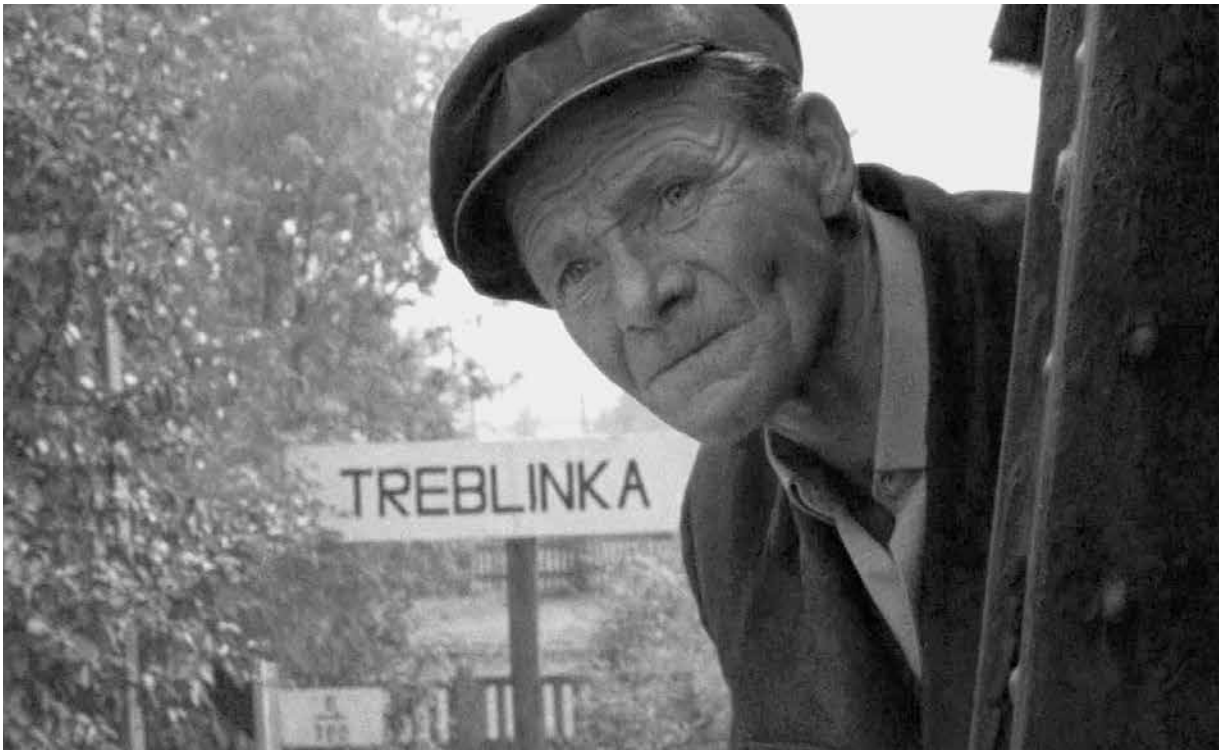
Jan Pivonski, el maquinista de Treblinka

mirant enrere, en el que ja és una imatge icònica d'aquells terribles esdeveniments.