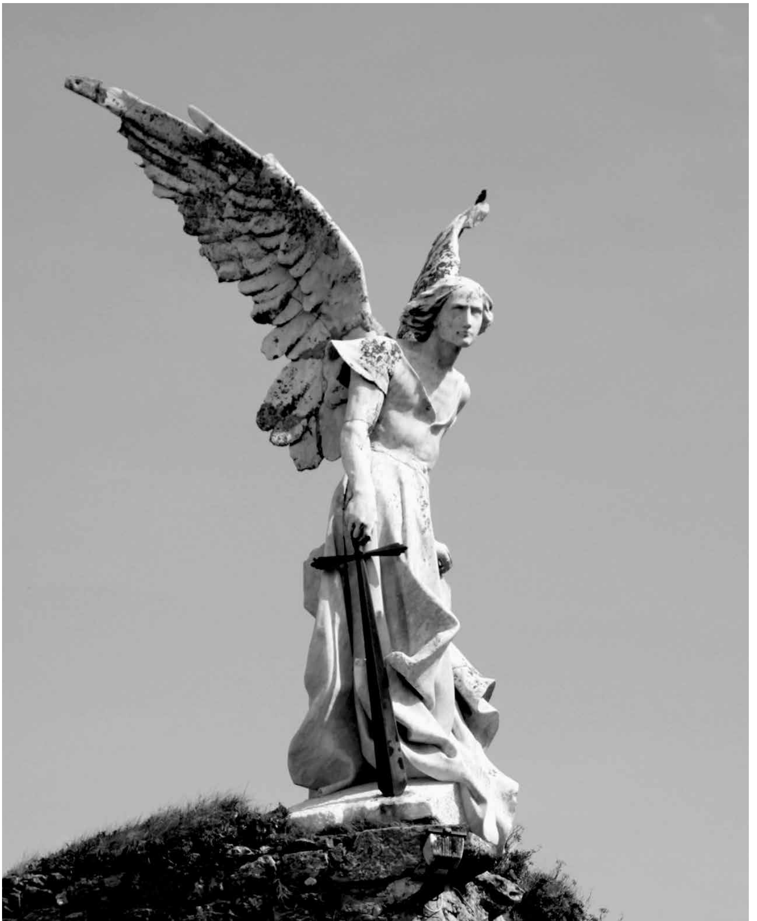
Àngel exterminador del cementiri de Comillas. Escultura de Josep Llimona (1895)