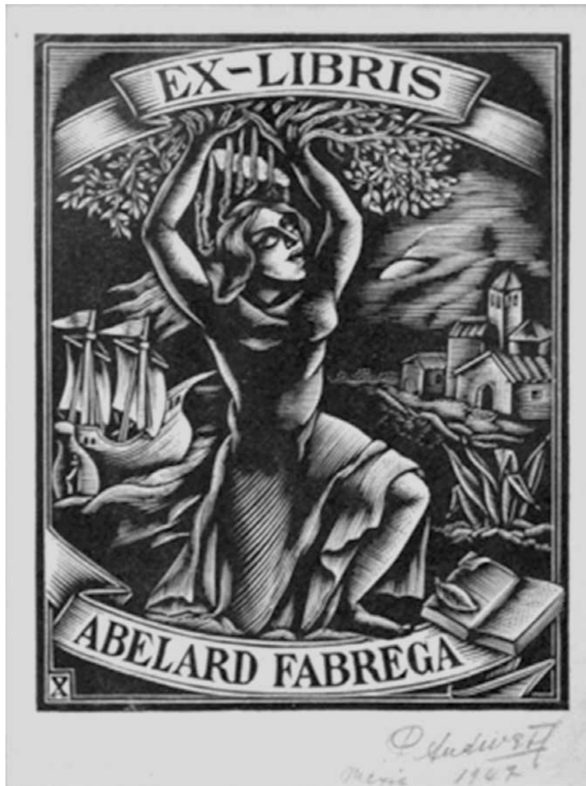
Exlibris d'Abelard Fàbrega (Pompeu Audvert i Mir, 1947)