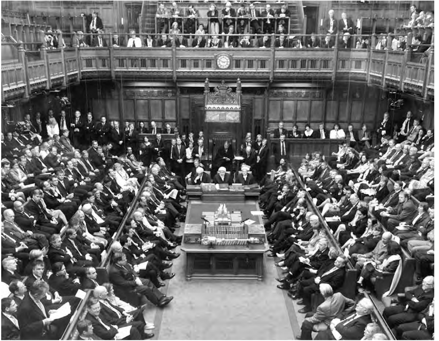
El Parlament britànic