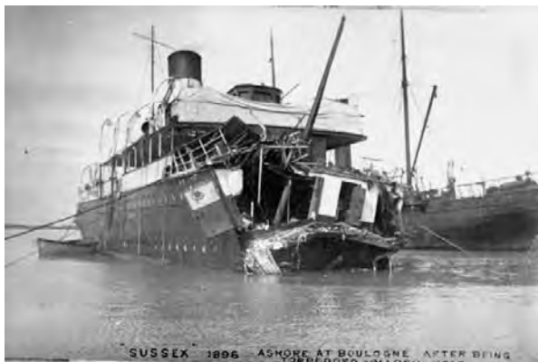
El vaixell Sussex, torpedinat

jectar-se, més encara, món enllà, per bé que aquesta dinàmica es veurà alterada inicialment per l'esclat de la Primera Guerra Mundial, que trastoca els seus plans. Però més enllà d'aquestes circumstàncies, el músic de Lleida està cridat, dissortadament, a un vida breu, i la mort el vindrà a buscar ben aviat.