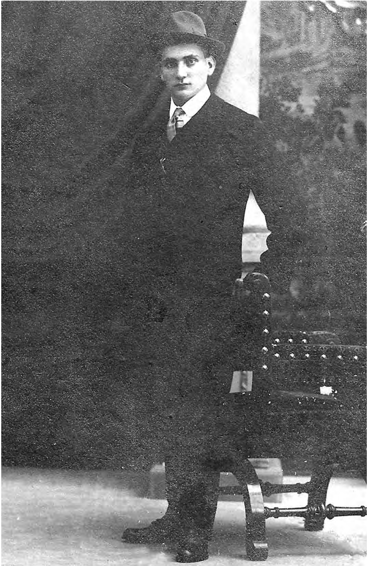
Josep Raventós i Casals