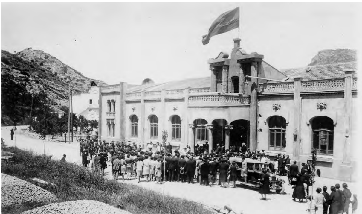
Vestíbul del Casino el dia de la inauguració (29-5-1928)

constituir les noves autoritats locals i compartir un mateix espai polític, sota els postulats del Glorioso Movimiento Nacional . 7