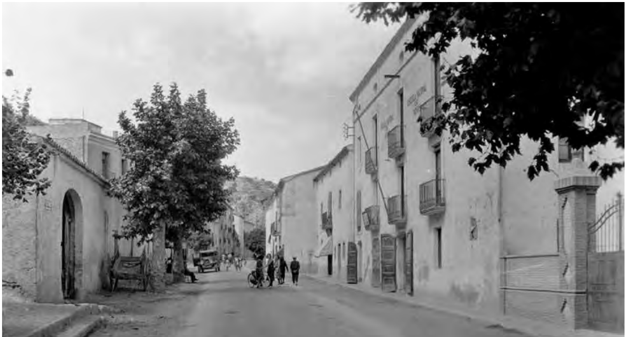
L'ajuntament i les escoles, a l'inici dels anys trenta del segle passat