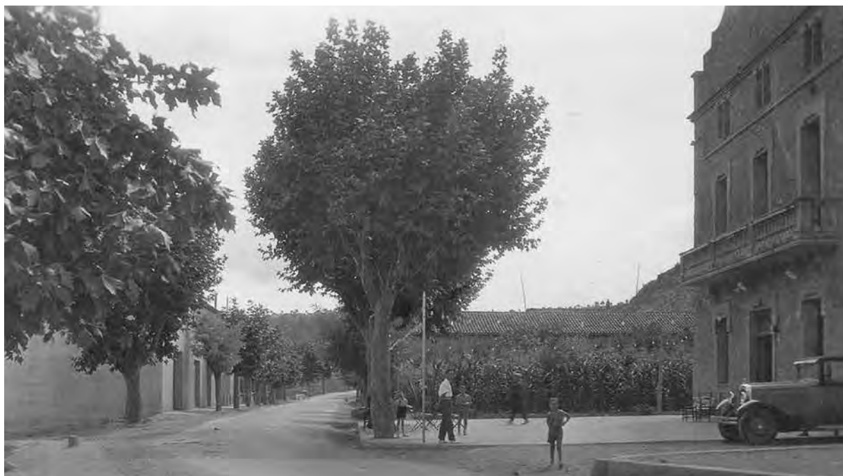
El Centre Republicà (avui, Ateneu Gumersind Bisbal) a l'inici dels anys trenta del segle passat