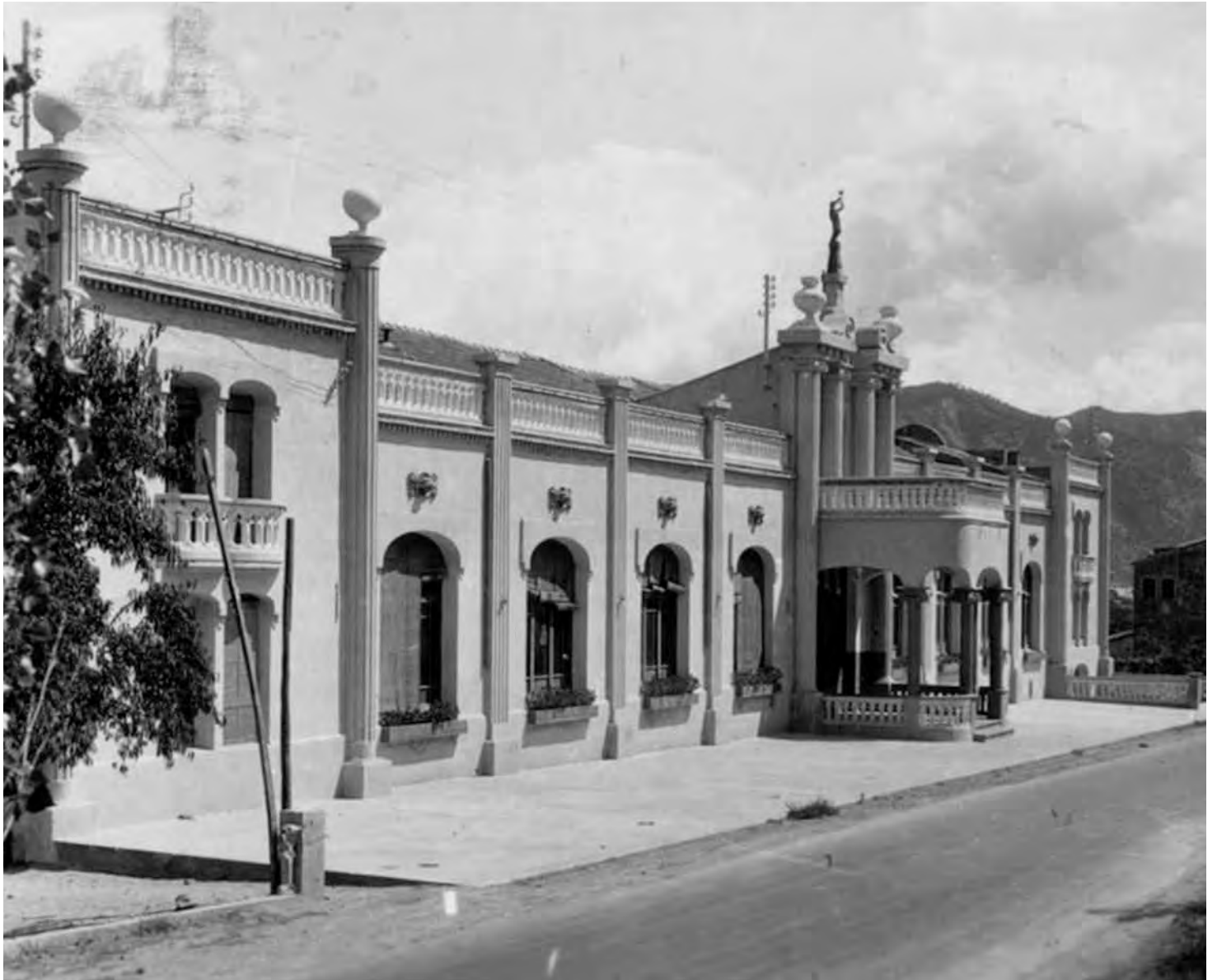
El Casino, a l'inici del anys trenta del segle passat. L'any 1941, quan es va reobrir el local, a sobre de la porta d'entrada del vestibul hi van pintar un gran rètol amb el nom de Centro Nacional.