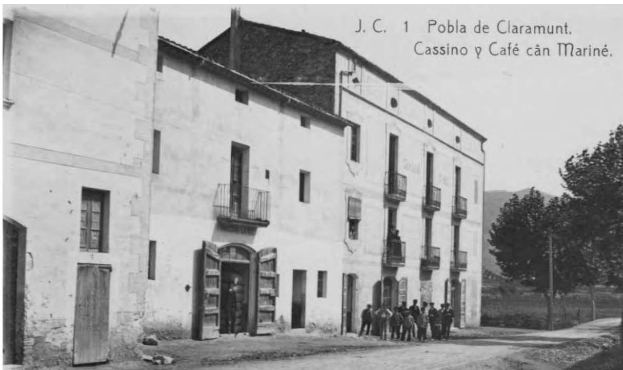
Edifici actual de l'ajuntament de la Pobla al principi del segle XX, quan hi havia un Casino i el café de Can Mariné