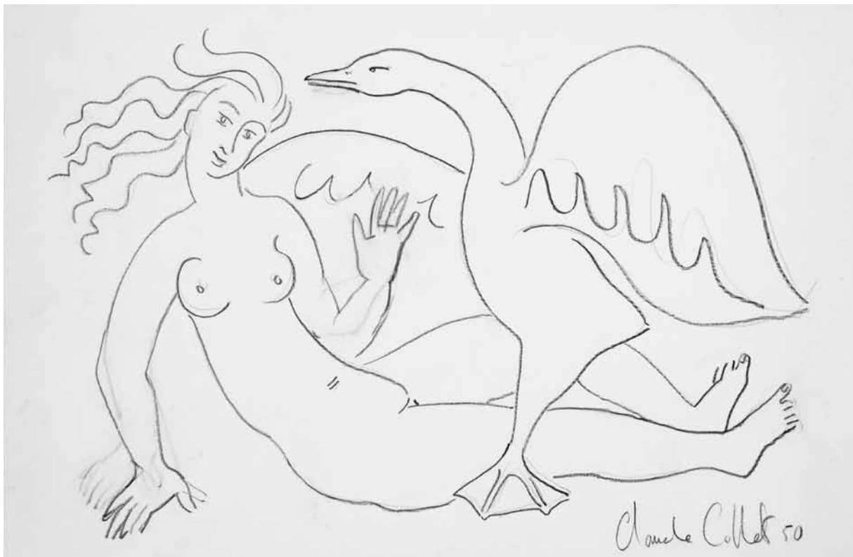
Leda i el cigne (1950) - 25 x 35,5 cm - Llapis sobre paper

cigne, El rapte d'Europa o les seves dones nues, ens mostren una sensació de plaer i d'emancipació que diferencia les seves pintures de les que es produïen aquells anys arreu de l'Estat espanyol.