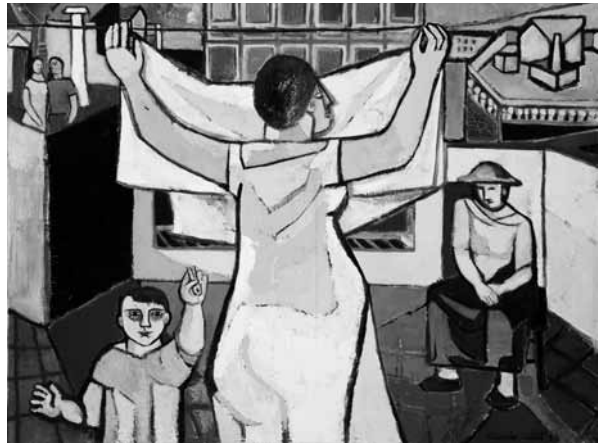
Les tres edats de la dona (1956) - 89 x 115,5 cm - Oli sobre tela

En el desenvolupament de la seva obra veiem com ella sempre va intentant cercar noves formes d'expressió, noves tècniques. Cal veure els seus paisatges creats entre 1954 i 1961. En els primers ja es nota el seu interès pel tractament geomètric, per marcar el perfil dels terrats, de les baranes dels sostres del edificis, etc., posant com a fons la serra de Collserola. En obres del inicis del anys seixanta podem dir que la presència de Léger torna amb força. La geometria es fa més definida, les cases i edificis són elaborats per plans de color amb tintes planes. Dins del conjunt d'aquestes obres, en les quals el caràcter narratiu és inexistent, n'hi ha una que sorprèn per la seva càrrega conceptual: ens referim a Les edats de la dona , del 1956. Iconogràficament, es relaciona de manera molt directa amb «Les edats de la vida», però ella ha