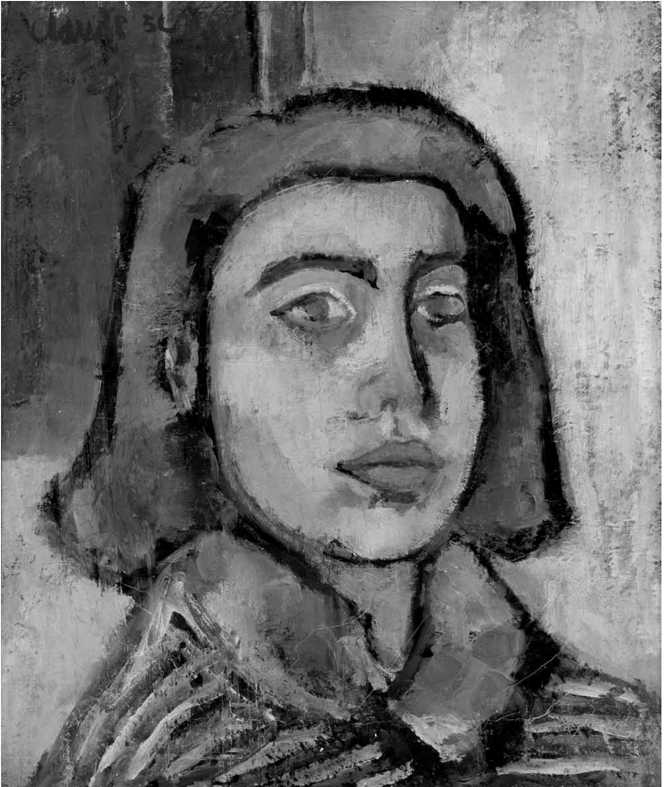
Autoretrat (1952) - 46 x 38 cm - Oli sobre tela