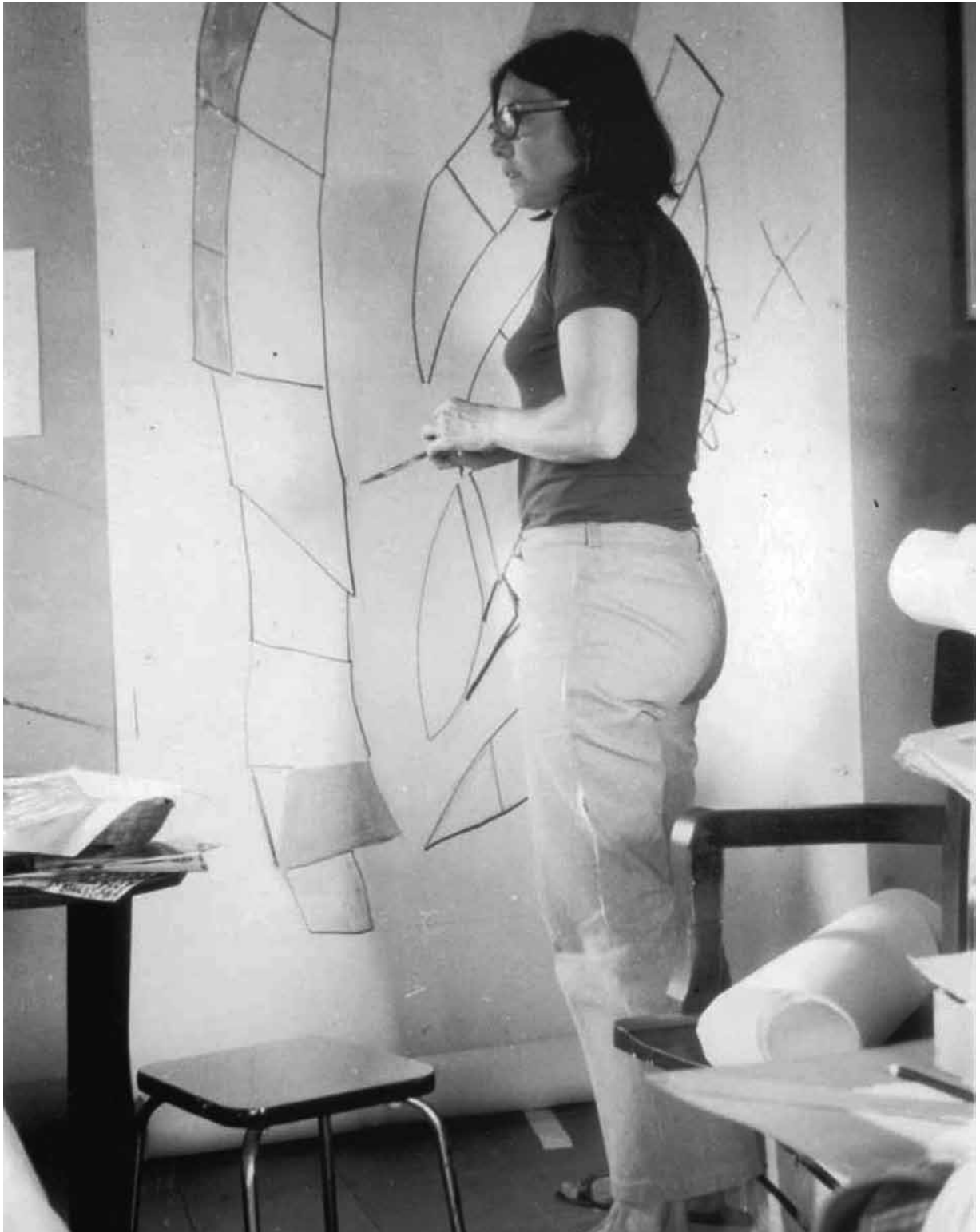
Primers esbossos per a un vitrall