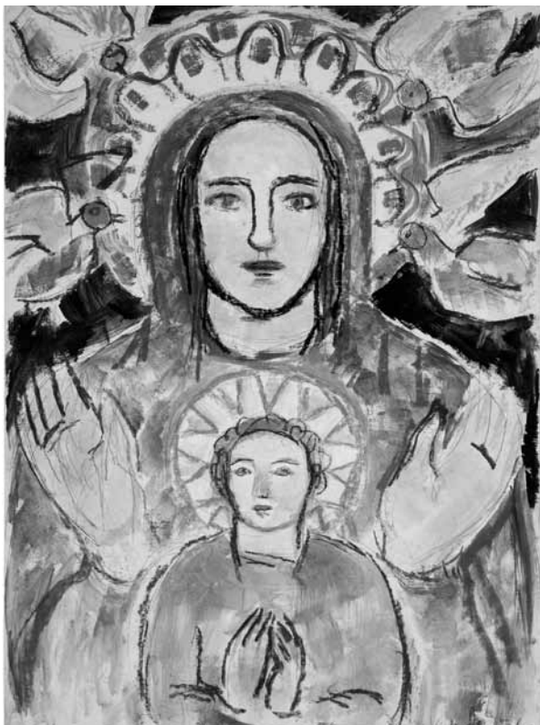
Verge (1951) - 54 x 38 cm - Ceres sobre paper

tocat de viure, en la qual el treball de les dones en qualsevol altra feina que no fos la tradicional de casa era simplement una tasca més, afegida a allò que s'entenia com a deures conjugals, deures de mare i de filla.