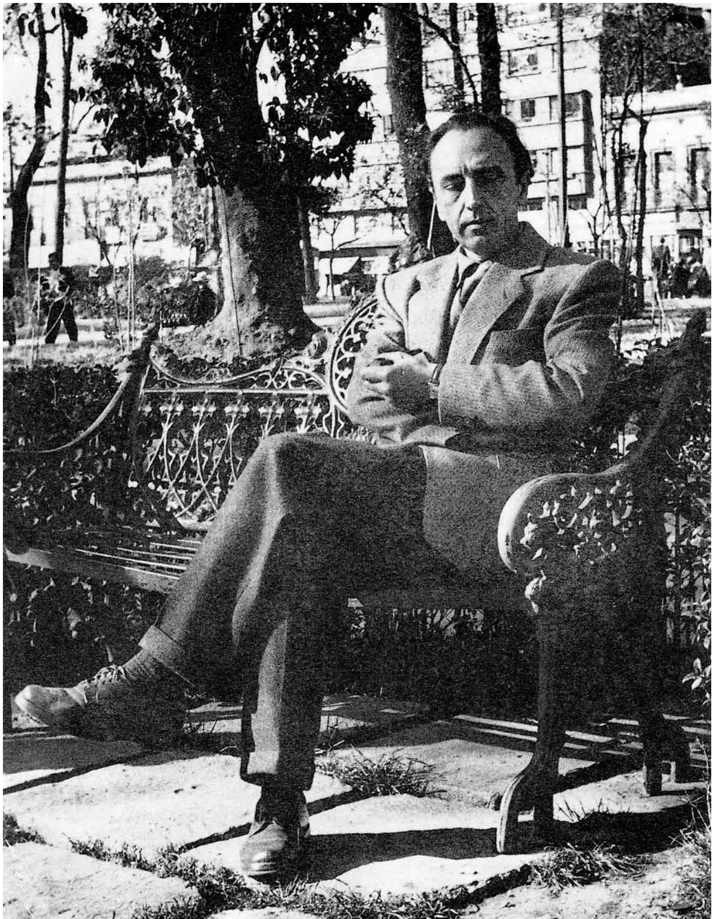
Agustí Bartra a Mèxic, l'any 1951