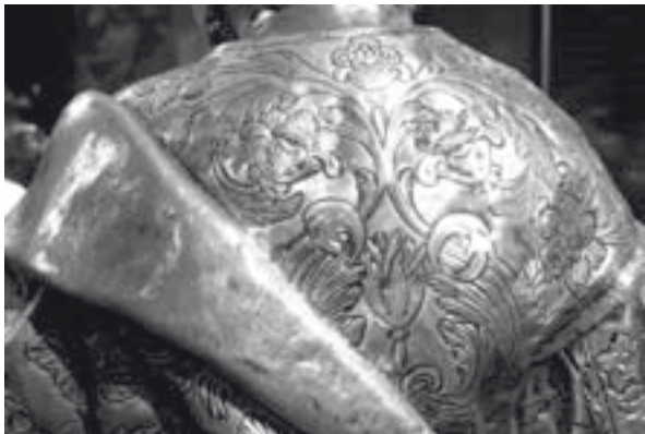
Imatge de plata de Sant Bartomeu. Detall de l'espatlla, amb la decoració de roleus florals a la túnica i el mantell amb un fons acabat amb el punxonat