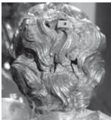
Detall del cap, amb els flocs de cabells pintats damunt de l'argent i restes d'un antic ancoratge per a la corona, avui perduda