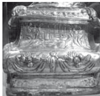
Base o peanya, amb l'escut d'Igualada i els el·lipses típics de l'època

siglo XVIII, pudo ser sustraída a la destrucción que sufrieron tantas otras durante el período 1936-39. Es costumbre exponerla en el altar mayor el día de su festividad, Fiesta Mayor desde tiempo inmemorial.»