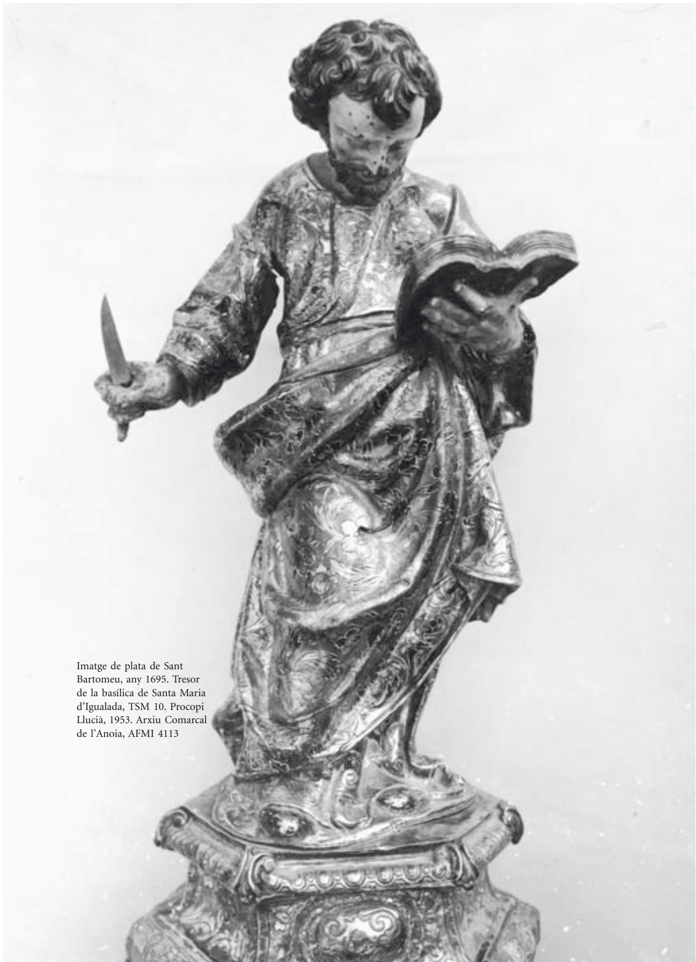
Imatge de plata de Sant Bartomeu, any 1695. Tresor de la basílica de Santa Maria d'Igualada, TSM 10. Procopi Lluçà, 1953. Arxiu Comarcal de l'Anoia, AFMI 4113