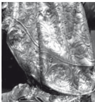
Detall de la falda de la figura