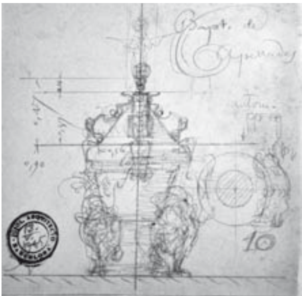
Croquis de la pica baptismal de Santa Maria de Capellades. J.M. Jujol, 1945. Llapis sobre paper. Arxiu parroquial de Santa Maria de Capellades

artificial Butsems y C a a finals del 1944, segons consta en la documentació de l'arxiu parroquial. 6 L'import de «1 pila baptismal n o 21, en marmori-ta con apliques, inscripció y caperusa» va ser de mil dues-centes cinquanta pessetes. Jujol tenia la intenció de modificar el disseny de la peça seriada. De l'observació del dibuix deduïm que als peus hi hauria dues figures, probablement dos lleons. 7 La tapa de la pica estaria decorada resseguint el seu perímetre piramidal, amb peces de contorn irregular, segurament de fusta o de guix. Finalment, a la part superior es disposaria una escultura. Jujol va preveure un mecanisme d'obertura i tancament per desplaçar la tapa. No oblidant la seva condició d'arquitecte, tenia en compte la funcionalitat de la peça.