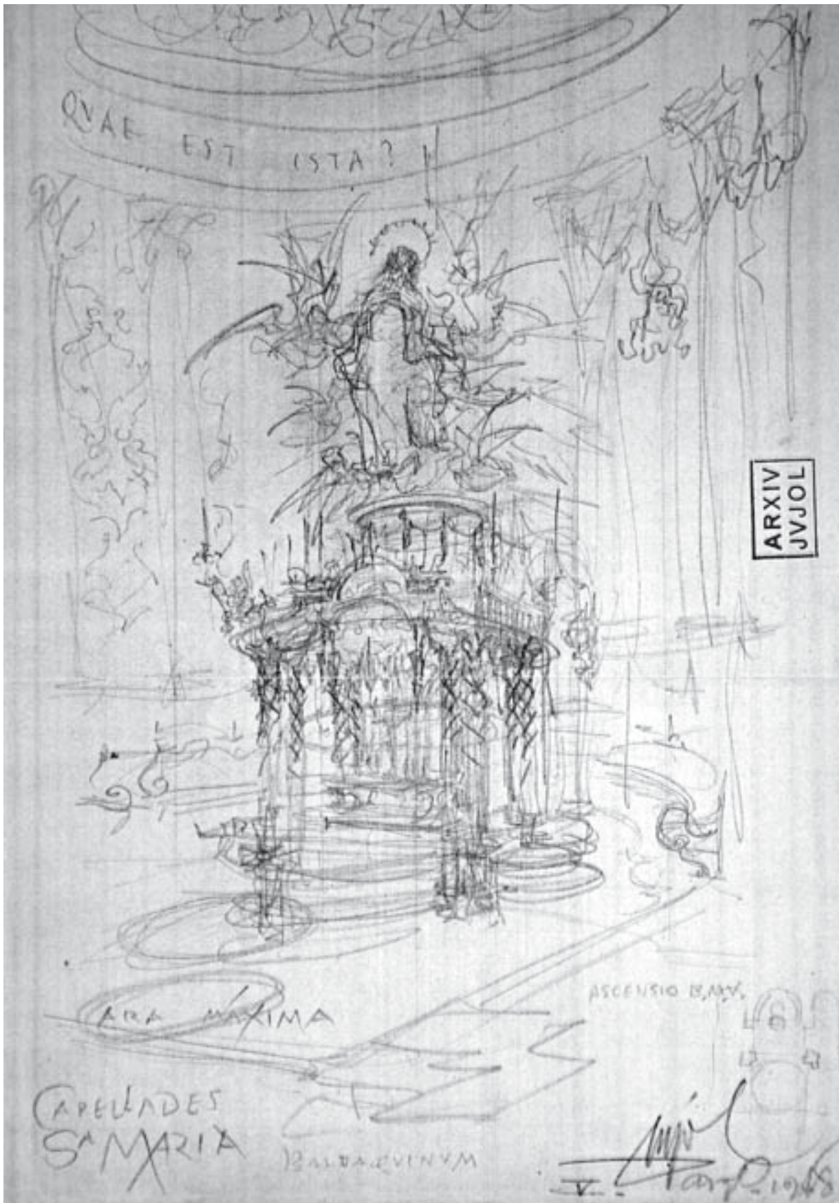
Baldaqú de Santa Maria de Capellades. J. M. Jujol, 1948. Llapis sobre paper. Arxiu Jujol dipositat a l'arxiu històric del Col·legi d'Arquitectes de Catalunya