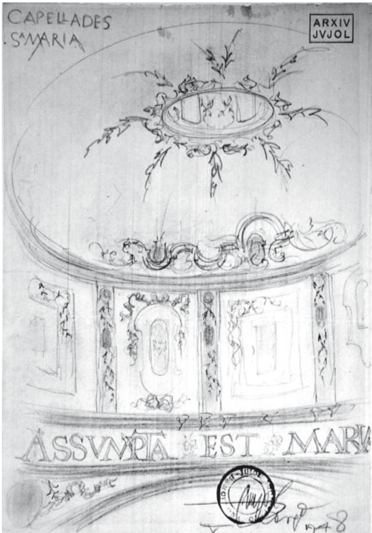
Croquis del cimbori de Santa Maria de Capellades. J. M. Jujol, 1948. Llapis sobre paper. Arxiu Jujol dipositat a l'arxiu històric del Col·legi d'Arquitectes de Catalunya