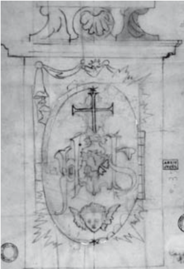
Croquis del sagrari de la capella del Pilar. J. M. Jujol, 1946. Llapis sobre paper. Arxiu Jujol dipositat a l'arxiu històric del Col·legi d'Arquitectes de Catalunya