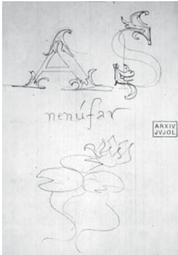
Croquis de detalls. J. M. Jujol, s/d. Llapis sobre paper. Arxiu Jujol dipositat a l'arxiu històric del Col·legi d'Arquitectes de Catalunya

La forma de les lletres del tambor va ser motiu de debat. Segons Escala, l'arquitecte va projectar la frase llatina emprant unes lletres excessivament barroques i ornamentades, de mides diferents. Campoy les va canviar per les de perfil recte que es poden veure actualment. En Jujol va manifestar-hi el seu descontentament i, per imposar el seu criteri estètic, va voler «jujolitzar-les» fent que s'hi afegissin «sabates», segons les seves paraules, és a dir, un motiu decoratiu als seus extrems. En els dibuixos del cimbori, les lletres són de mida regular i de perfil recte sense cap tipus d'ornamentació, però en un altre esbós es comprova la voluntat de l'afegit ornamental que s'havia de traspasar a la paret. Comparant-ho