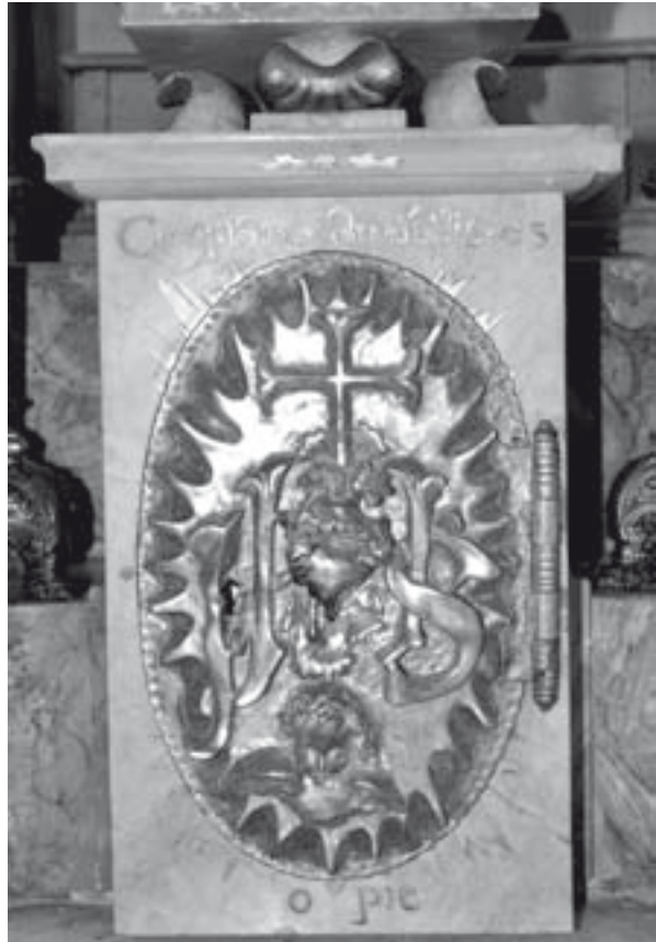
Sagrari de la capella del Pilar