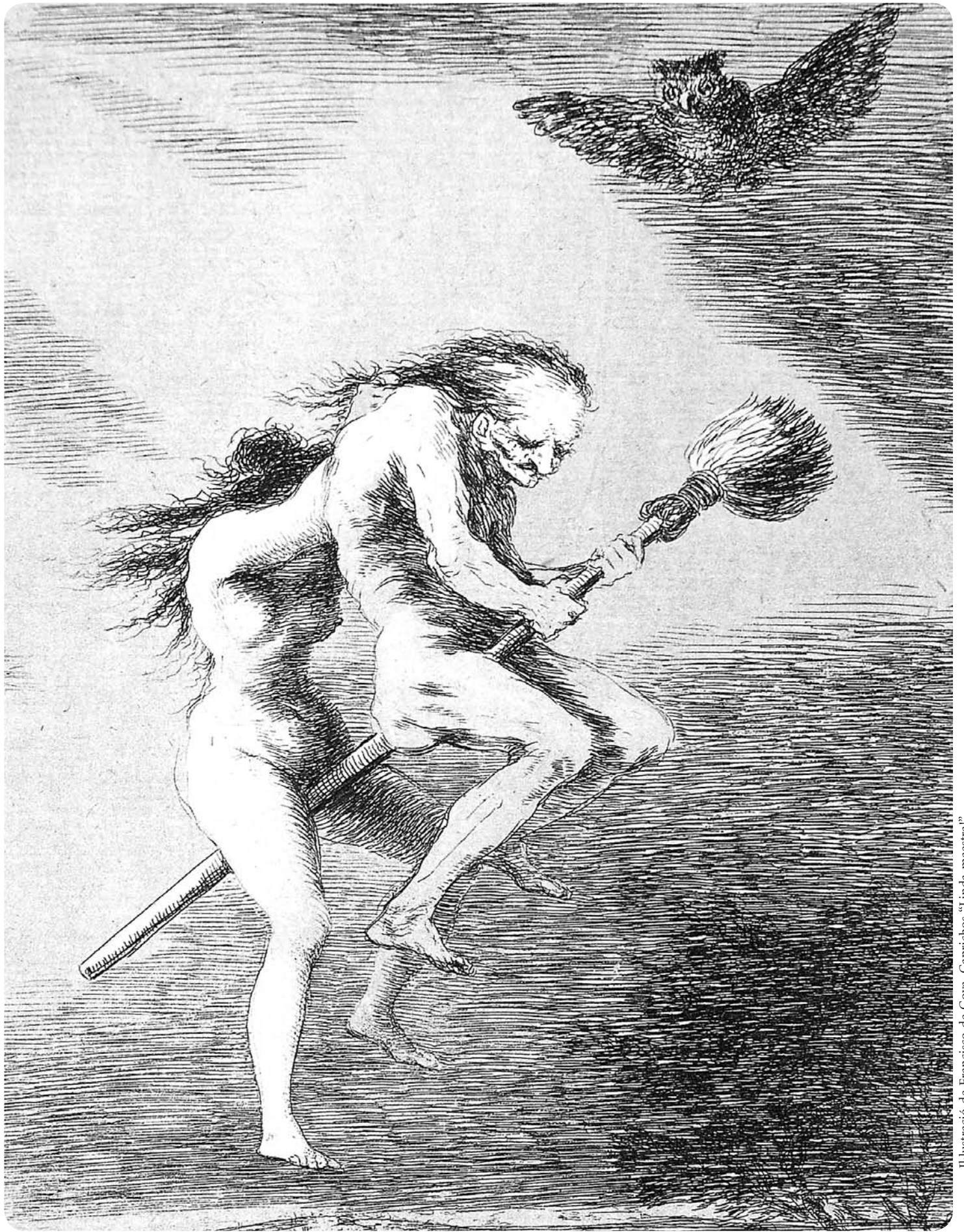
Il·lustració de Francisco de Goya. Caprichos "Linda maestra."