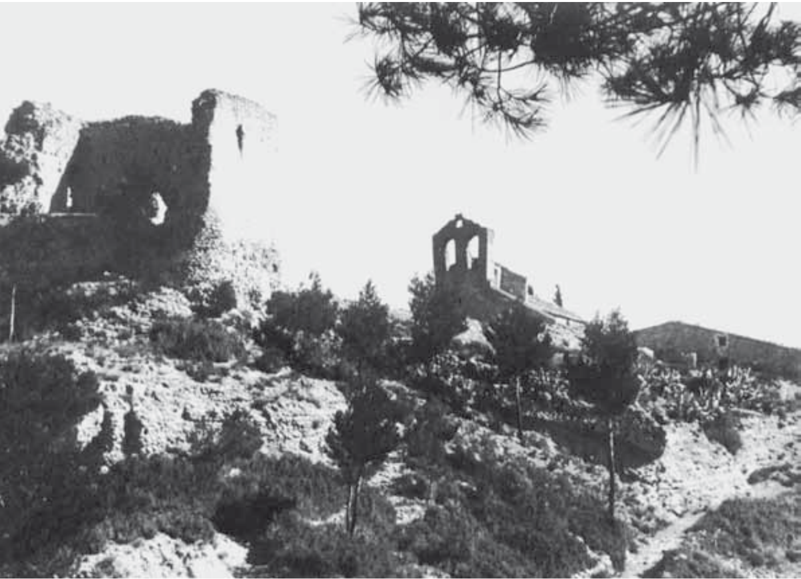
El cim de la Tossa al començament del segle XX. Aquest espai emblemàtic de la comarca era l'escenari del tram final del ritual del Salpàs a Montbui, fet que es produïa el diumenge de Pasqua