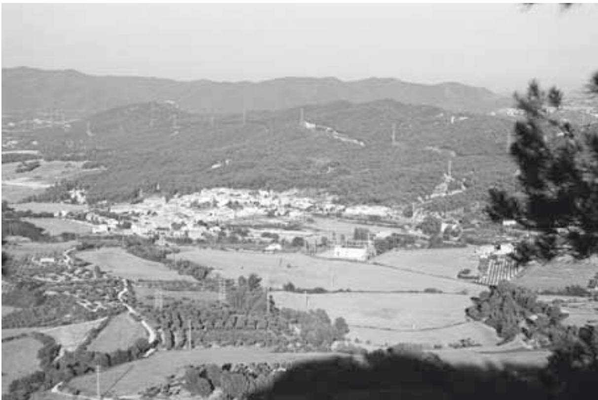
Santa Margarida de Montbui, vista des de la Tossa

fixant bona part de la tradició històrica local que després recopilarà al Rectorologio de Santa Maria de Igualada (1949). També aquest és l'únic document conegut que ens descriu una tradició ja perduda a Montbui de la qual només resisteix una petita part: la recol·lecció, el dimecres sant, de branques de romaní, utilitzades en el ritual del salpàs per aspergir la sal i l'aigua. Aquest document ha estat recentment digitalitzat i es troba disponible, per a la seva consulta, a l'Arxiu Parroquial de Santa Margarida de Montbui (on es conserva l'original) i a la Biblioteca Central d'Igualada. 14