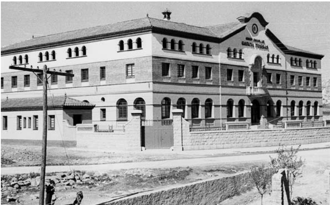
Façana de l'edifici Garcia Fossas de la Ctra. de Manresa (1937) (AFMI 536)