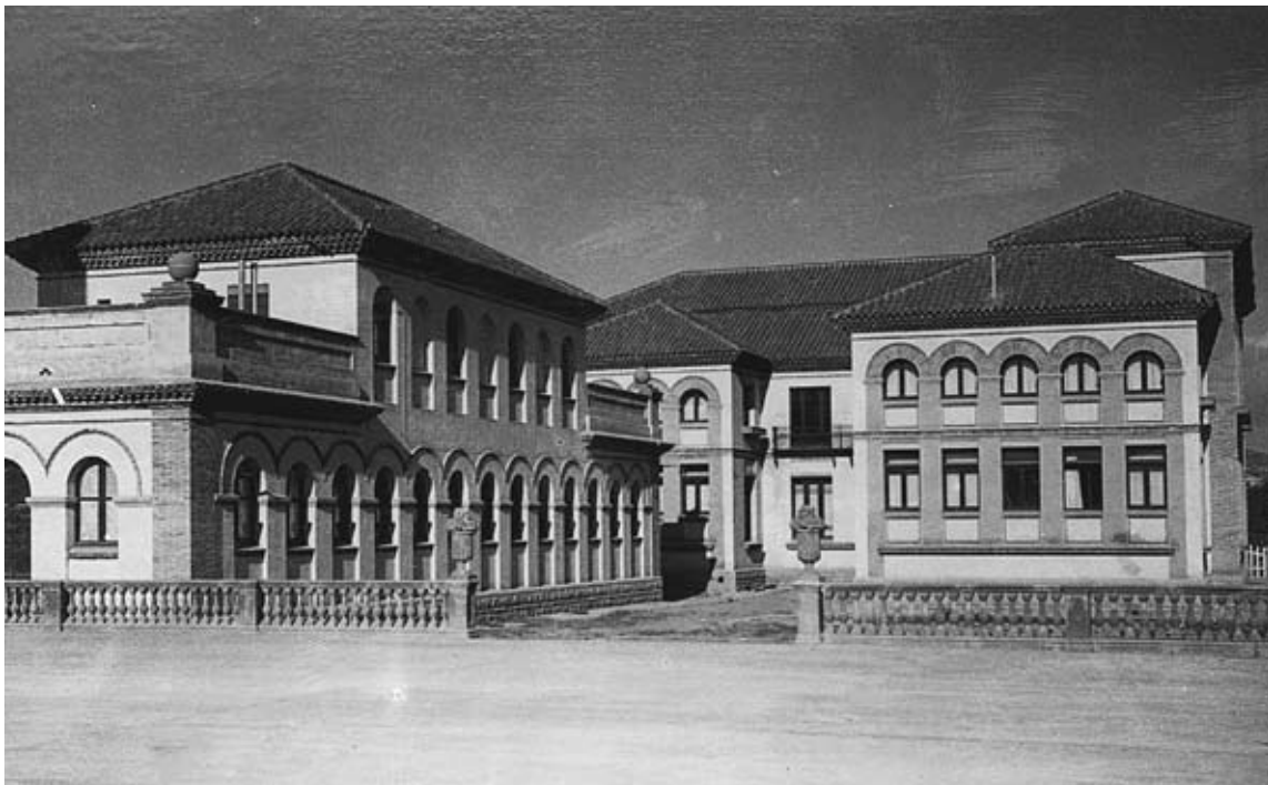
Vista posterior de l'edifici de la avinguda Balmes (1934) (AFMI 134)