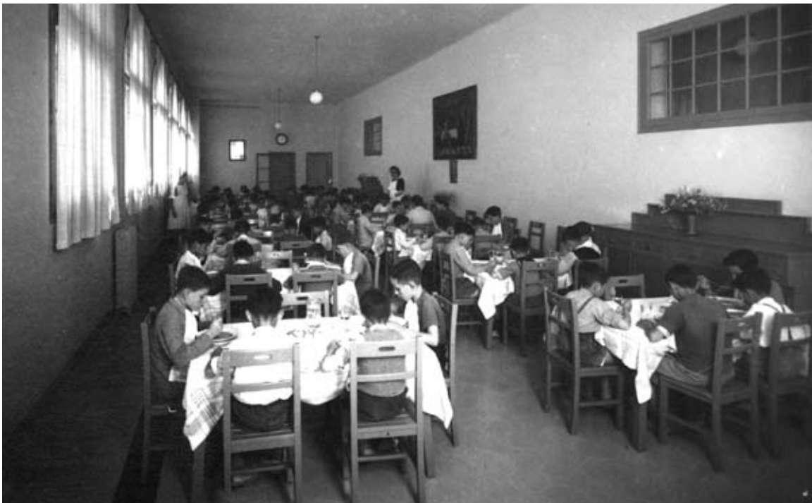
Menjador escolar del Grup Escolar Garcia Fossas (1947) (AFMI 2765)