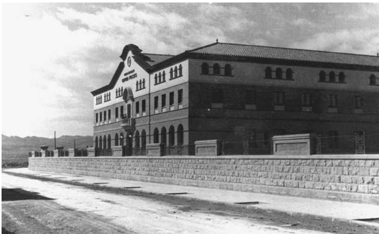
Façana de l'edifici Garcia Fossas a la Ctra. de Manresa (AFMI 0789)

1949 es va inaugurar el Museu de la Ciutat, que es va instal·lar precisament en una sala del segon pis de l'edifici de l'Orfenat.