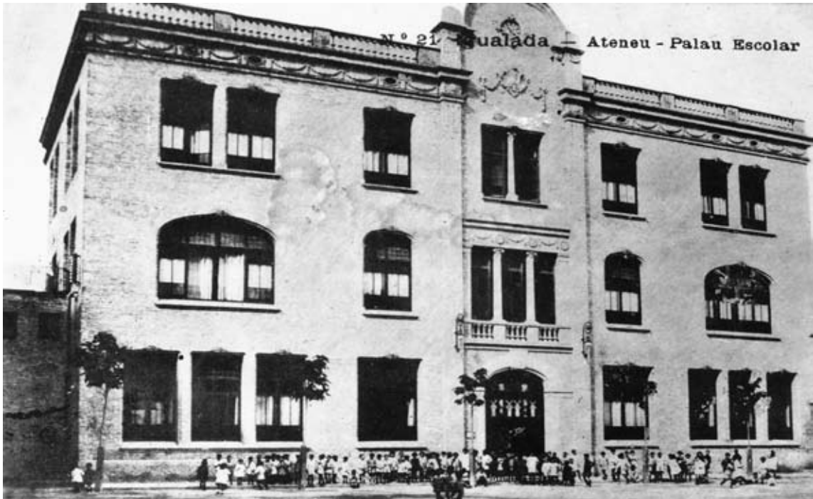
Vista de la façana del Palau Escolar, Ateneu (1933) (AFMI 3865)