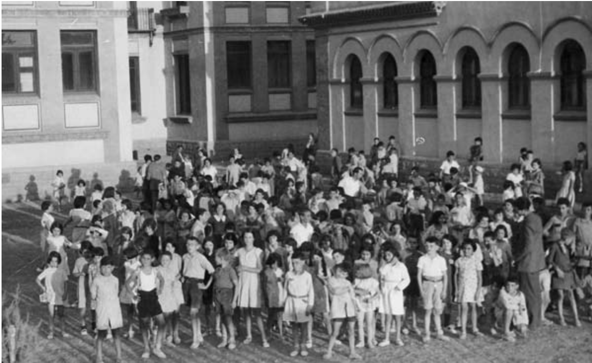
Colònies infantils a l'Institut Garcia Fossas (juliol i agost de 1933) (AFMI 0062)