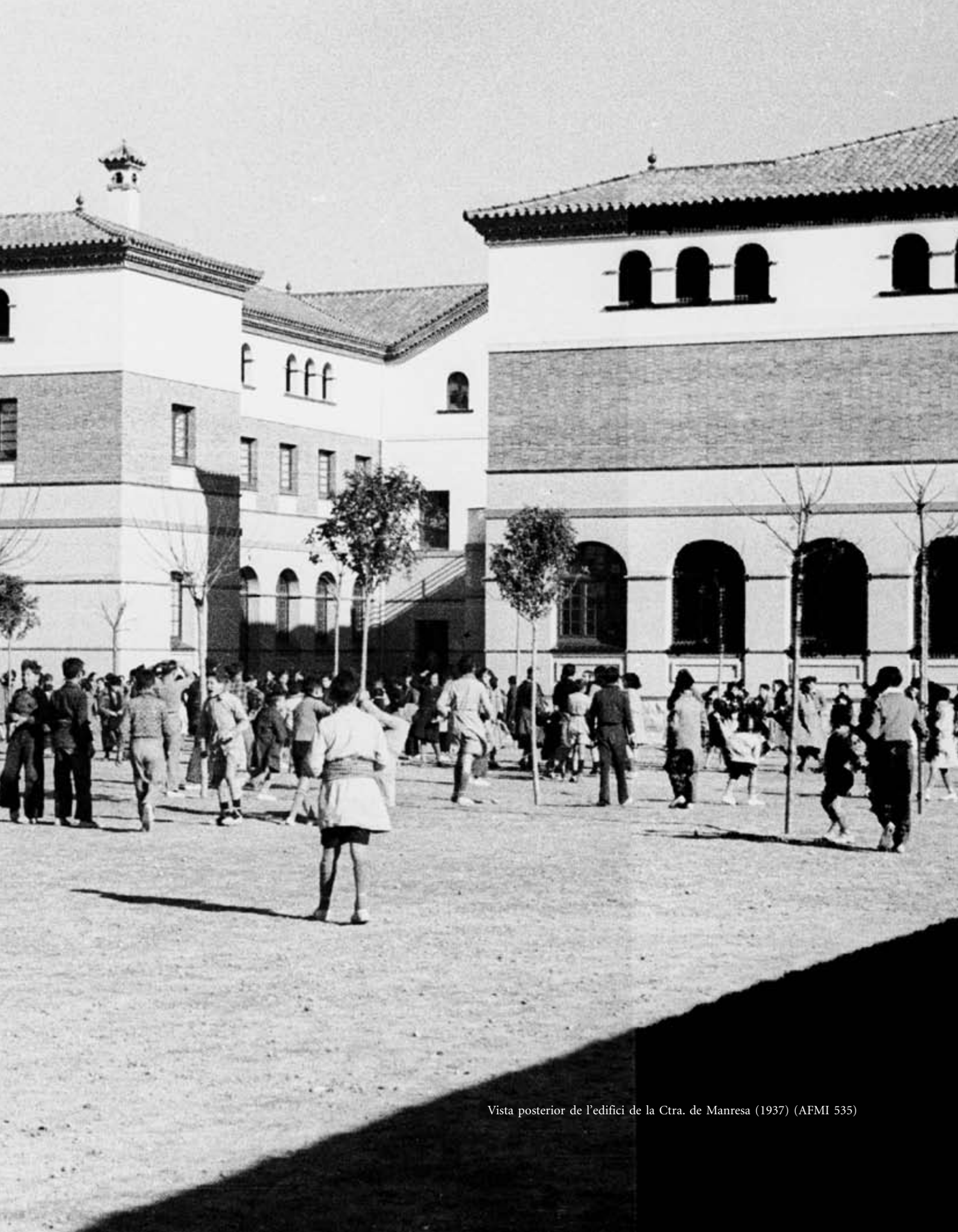
Vista posterior de l'edifici de la Ctra. de Manresa (1937) (AFMI 535)