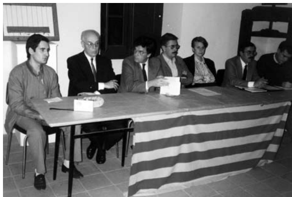
Presentació de la revista Estudis . 20 de març de 1985.

Una de les activitats més rellevants del Centre d'Estudis Comarcals d'Igualada ha estat la publicació de treballs de recerca històrica, literària, geogràfica, ciències naturals i socials... La primera obra que es va editar va ser la de Joan Mercader, Un igualadí del segle XVIII: Jaume Caresmar (1947) i, l'any següent, el 1948, va sortir dels tòrcols de la impremta Bas l'estudi de Josep Iglésies, Assaig sobre l'extensió de la comarca d'Igualada . En el curs de les dècades següents, el CECI va publicar treballs de recerca de temàtica diversa, editats en formats diferents segons les orientacions de la política editorial de l'entitat durant les etapes que s'han succeït al llarg de la seva trajectòria. Tanmateix, la Miscellanea Aqualatensia , que aplega treballs d'investigació realitzats dins i fora del CECI —i