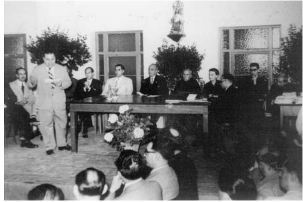
Exposició d'artistes igualadins organitzada pel CECI el 30 d'agost de 1947.

Color (1965) dedicat a les arts plàstiques; Celler d'Art, de la Pobla de Claramunt (1965)... Entre aquests, el grup filial que va tenir un impacte més remarcable en la trajectòria del CECI va ser el Grup Lacetània, creat el 1961 per Antoni Pous, que va esdevenir grup filial del Centre d'Estudis l'abril de 1962. Les seves activitats van assolir gran intensitat entre el 1962 i el 1965 —va organitzar un total de cent setanta-sis actes— i, sobretot, l'actuació cultural del grup va ser especialment important en el vessant de la renovació dels esquemes culturals que fins llavors havien caracteritzat la cultura igualadina.