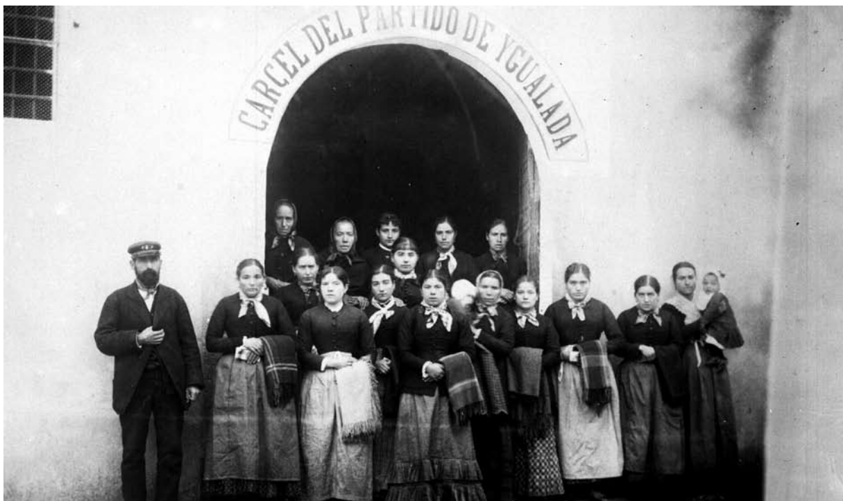
Teixidores de Carme en el moment de sortir de la presó (5-1-1885).

manifest adreçat a les dones obreres d'Igualada durant la vaga de 1913; 18