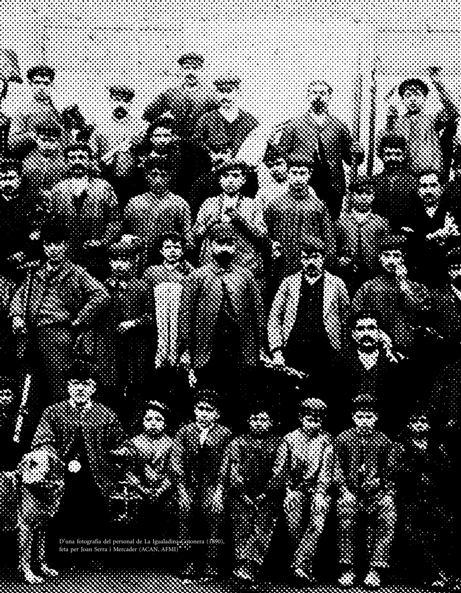
D'una fotografia del personal de La Igualadina-Cotonera (1890), feta per Joan Serra i Mercader (ACAN, AFMI)