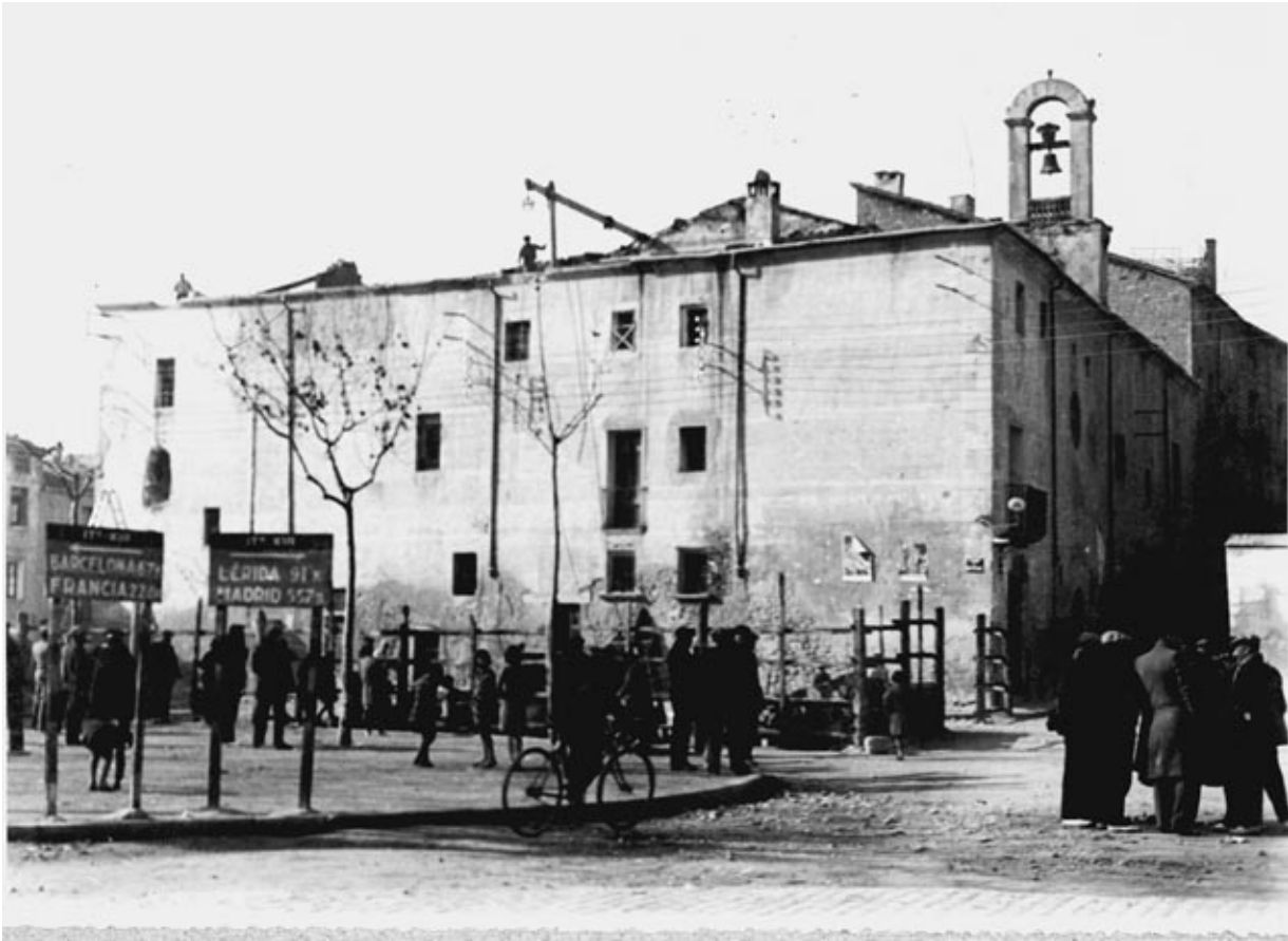
Plaça de l'Àngel, avui plaça del Rei, esmentada per primer cop l 1759. L'edifici que veiem és l'antic hospital. Al fons, l'antiga església de Sant Bartomeu, desapareguda el 1935.