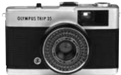
Olympus Trip 35 1968