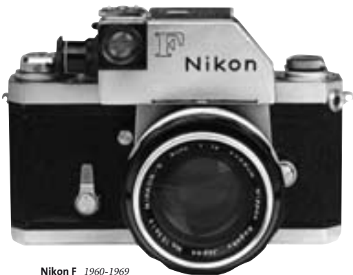
Nikon F 1960-1969