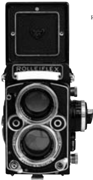
Rolleiflex 2.8F 1965