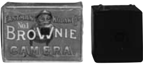
La Brownie 1900