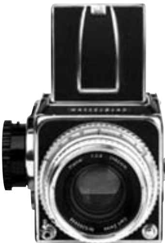
Hasselblad 500 1972