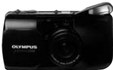
Olympus μ Zoom 1993

El primer dia que una càmera analògica (CA, a partir d'ara) es va trobar davant d'una càmera digital (DI, a partir d'aquí), se la va mirar atentament. Pel davant, pels costats, per dintre... Li va somriure amb educació i va tornar al seu prestatge privilegiat de l'estudi. Allò, per a ella, no representaria mai cap amenaça, el seu lloc en el món de la fotografia no corria cap perill, podia estar tranquil·la. Les DI potser es farien un lloc a les redaccions dels diaris i en algunes famílies poc primmirades amb els records gràfics. Però, als estudis dels fotògrafs, ni entrar-hi! Mai no aconseguirien la qualitat de color de les CA, ni fer invisible el gra, ni tants altres atributs que elles, amb tants d'anys i esforç, s'havien guanyat. I a més, com volien competir amb les CA si no sabien què era un teleobjectiu? Ni tan sols un zoom? Conclusió: la captació del món amb totes les seves formes, colors i matisos seguiria en mans de les CA!