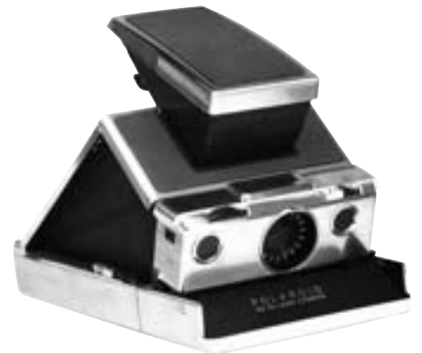
Polaroid SX-70 1972