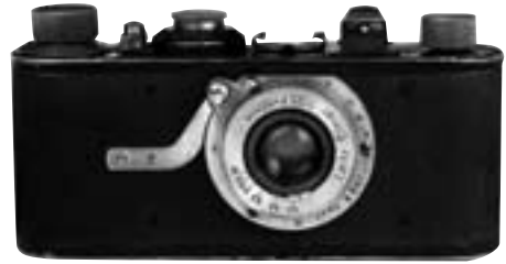
Leica 1A 1929