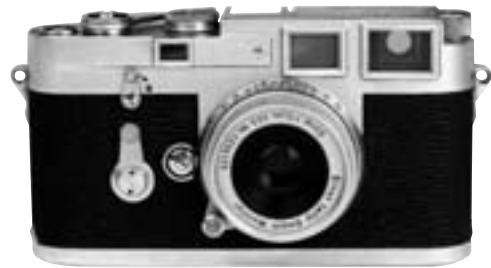
Leica M3 1954