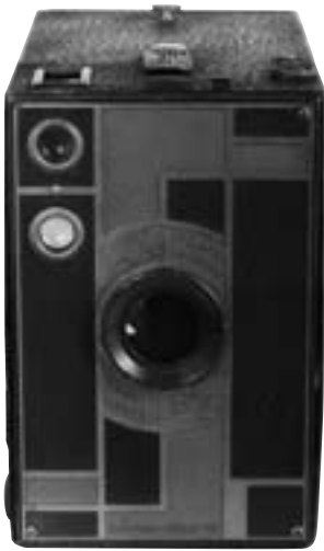
Brownie n. 2 Beau 1930