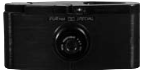
Purma Special 1937