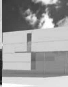
Hospital a Tarragona, 2003