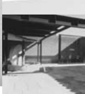
Museu de Cal Granotes, 1990