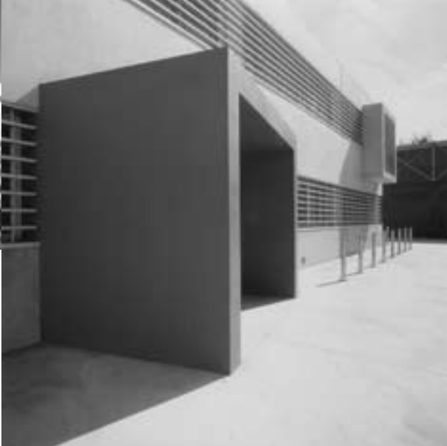
Centre d'assistència Primària a Sant Feliu de Llobregat, 1996