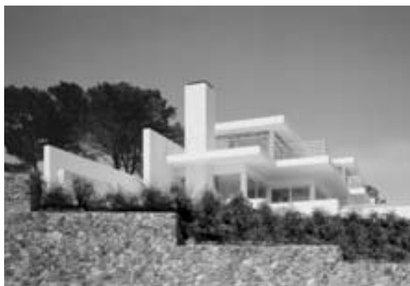
Casa a la Costa Brava, 2003

En definitiva, i resumint, és la manera de fer de les persones enamorades de la feina que fan.