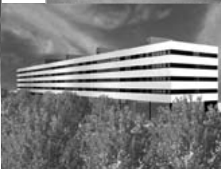
Edifici d'habitatges a Tarragona, 2003