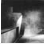
Bar a Igualada, 1990