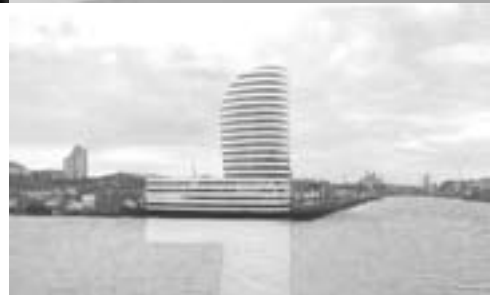
Edifici Administratiu Dublín (conkurs), 2003