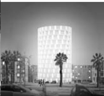
Hotel a Barcelona, 2002