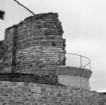
Restauració a Veciana, 1987