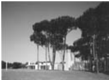
Casa a la Costa Brava, 1992