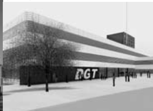
Direcció General de Trànsit, Màlaga (conkurs), 2003