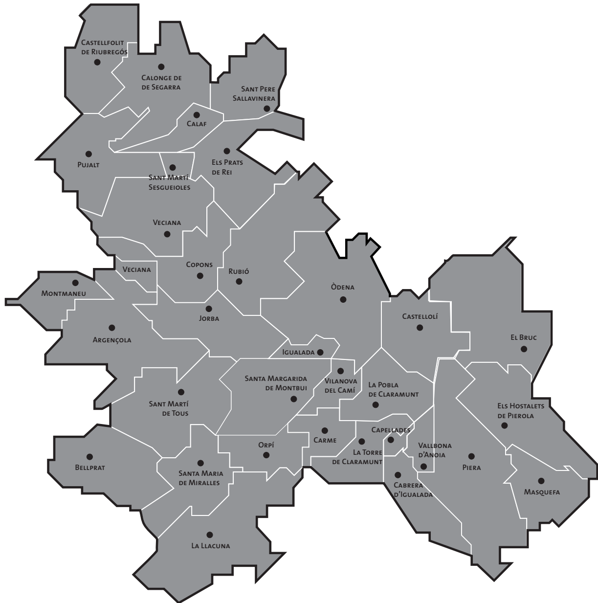
L'actual comarca d'Anoia