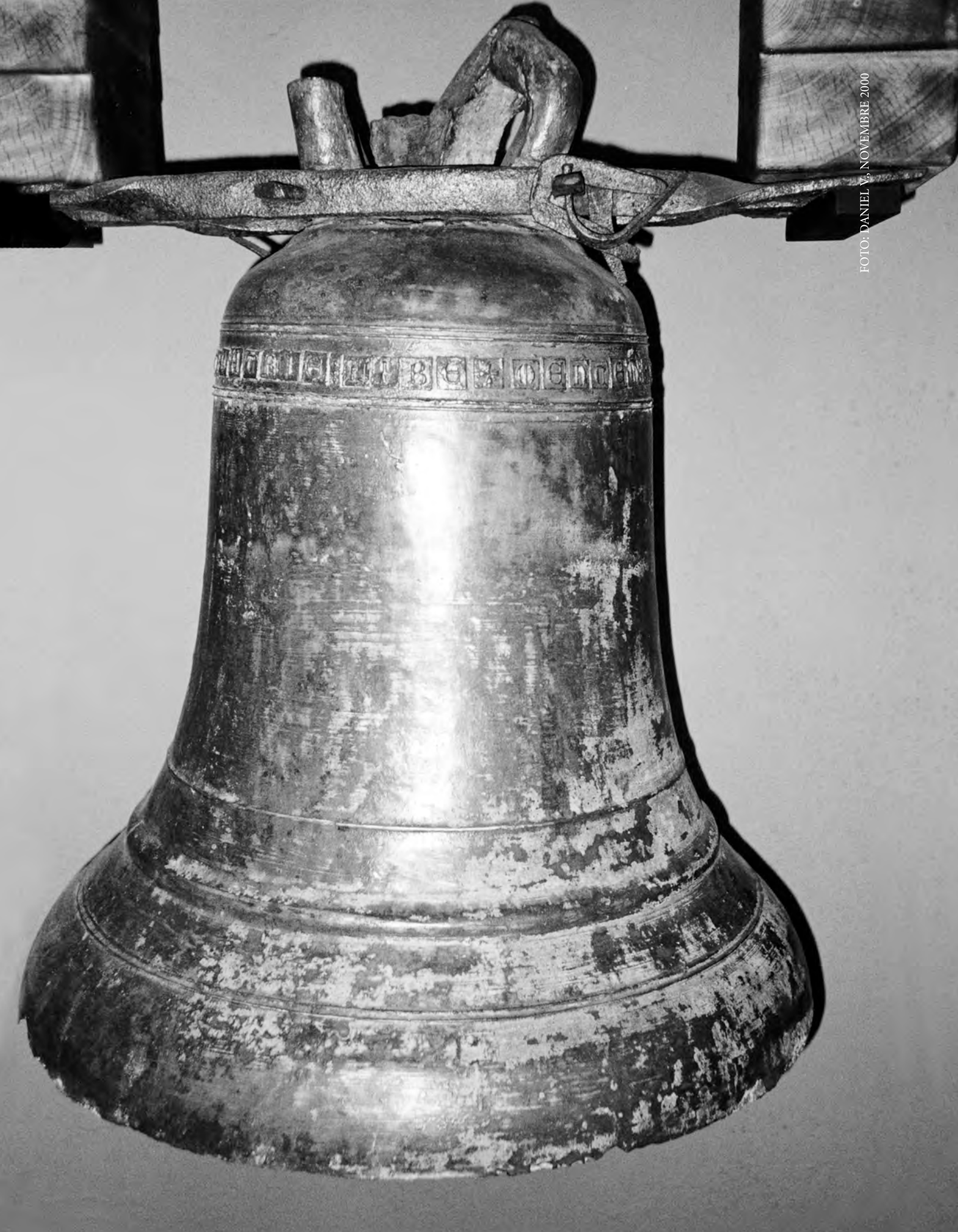
NOVEMBRE 2000