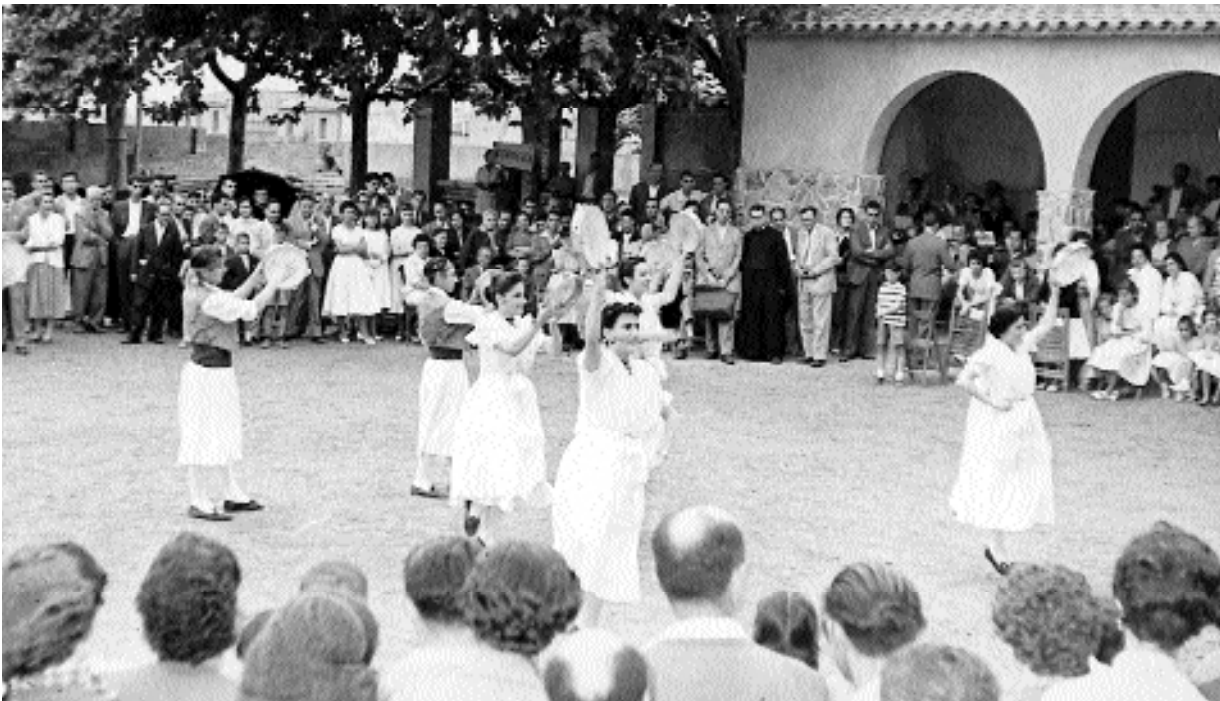
Jornada regional HOAC al Convent del caputxins d'Igualada, agost 1957