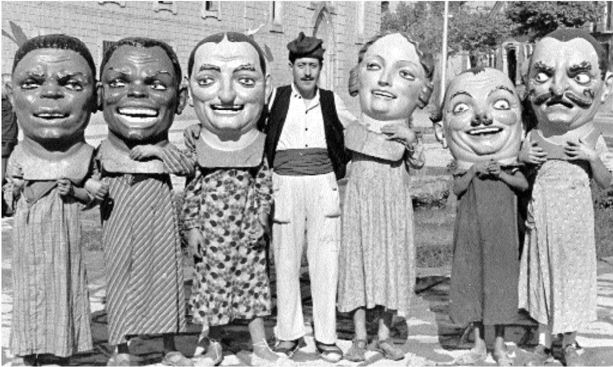
Nans del carrer de Sant Agustí