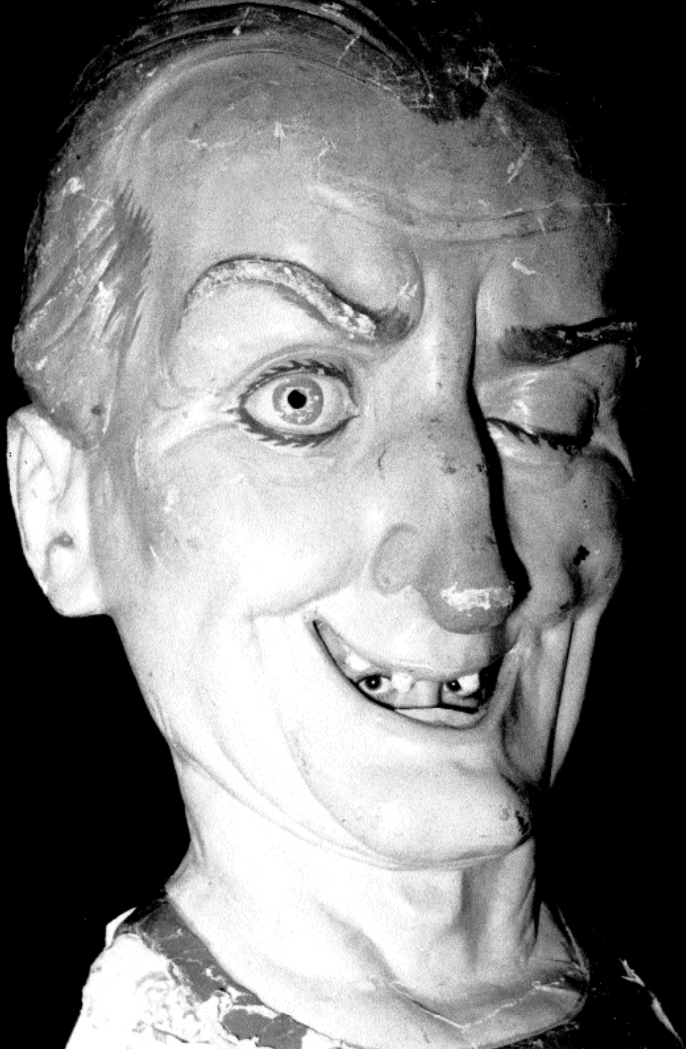
Capgròs del carrer de Sant Agustí