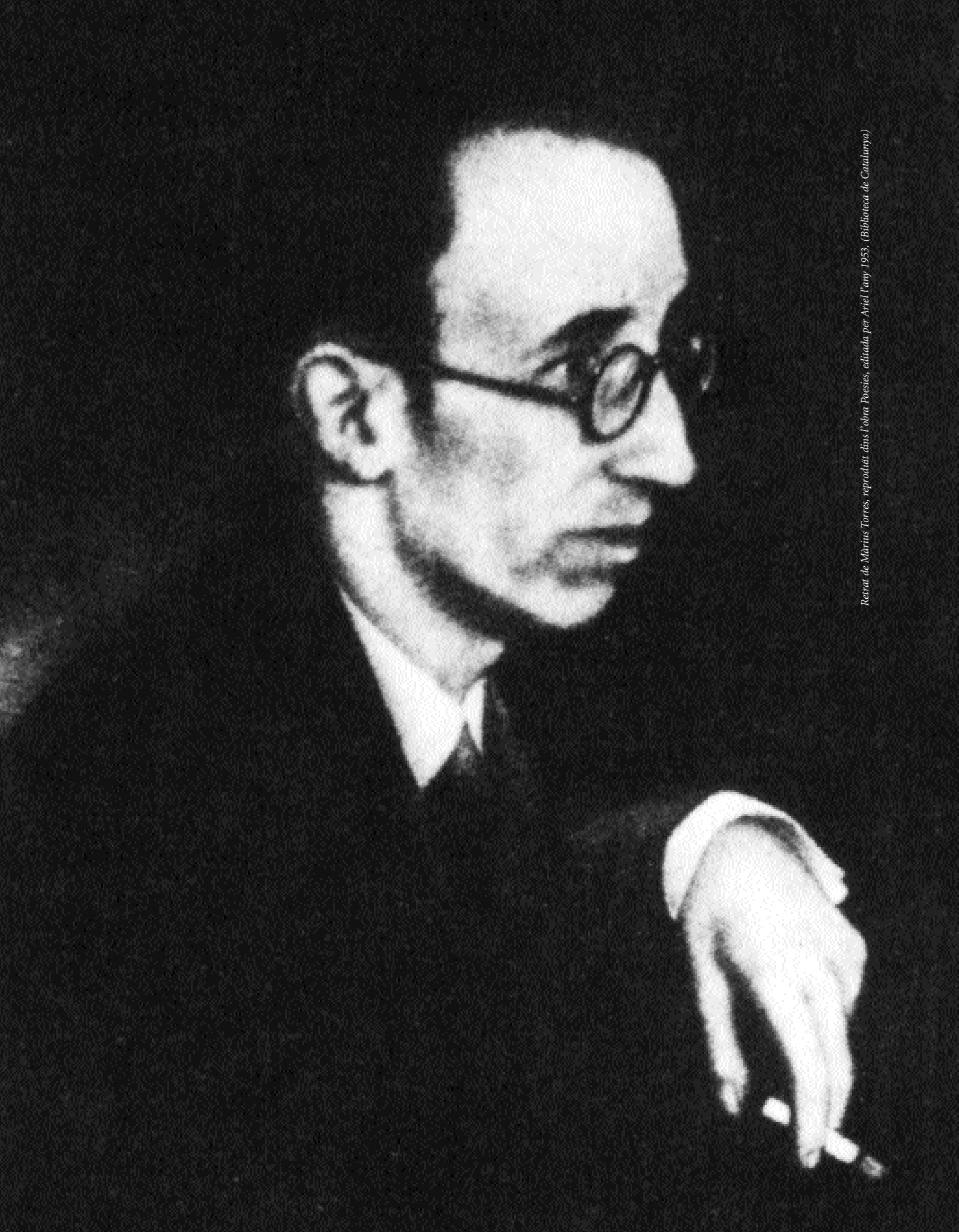
Retrat de Martí i Torres, reproduït dins l'obra Poesies , editada per Ariel l'any 1953.