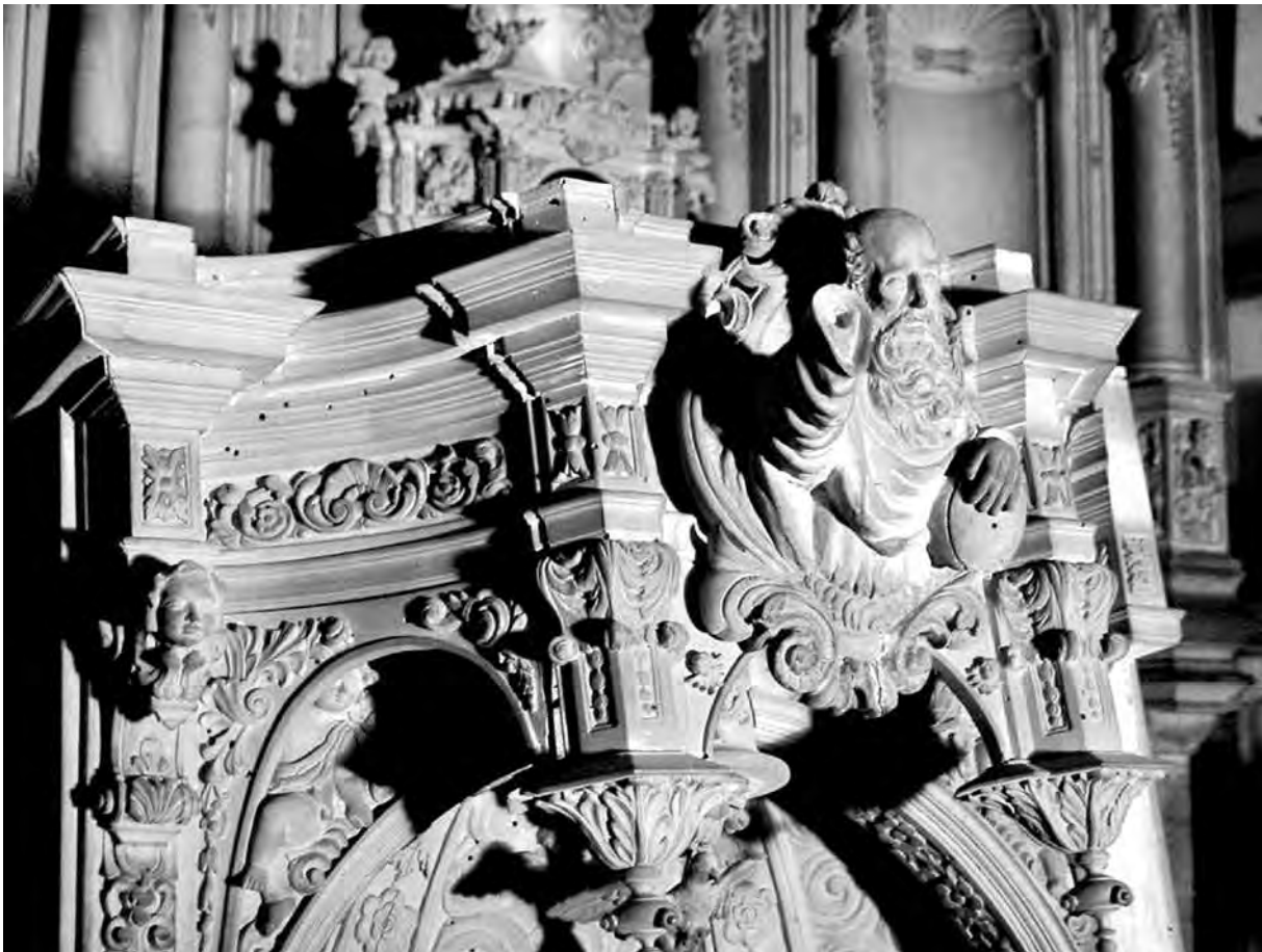
Aspecte de detall de la maqueta