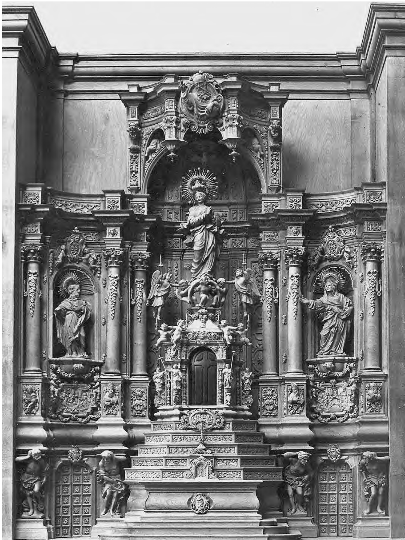
La maqueta. Programa de la Festa Major de 1945