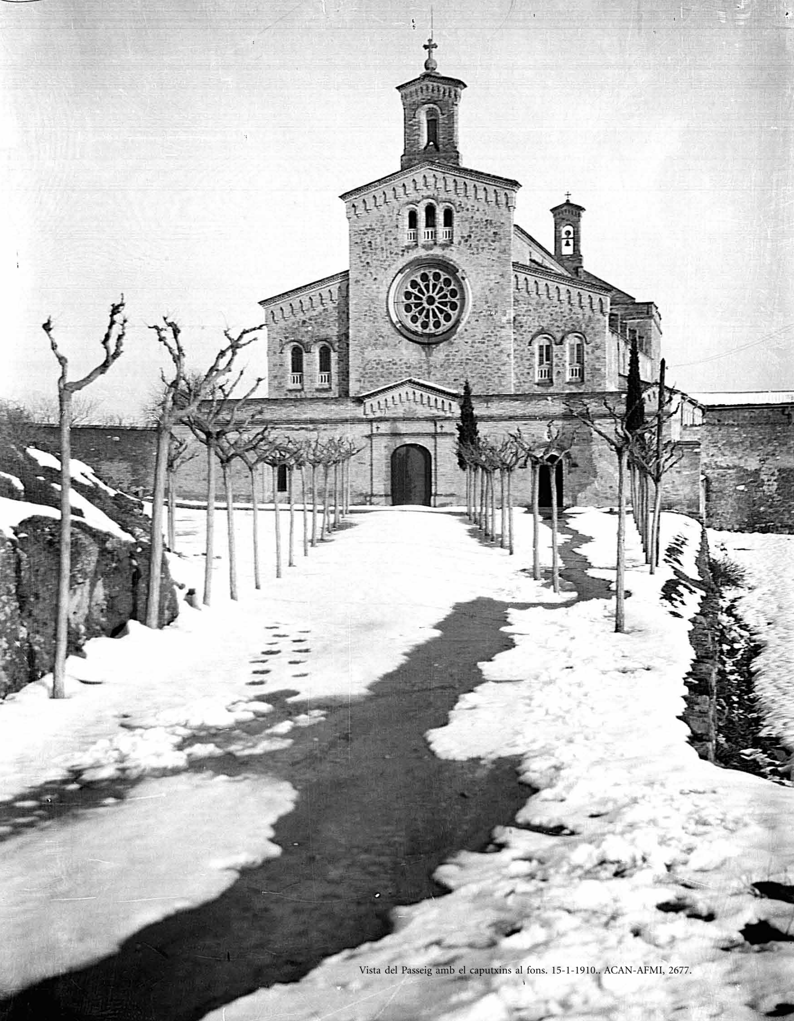
Vista del Passeig amb el caputxins al fons. 15-1-1910..