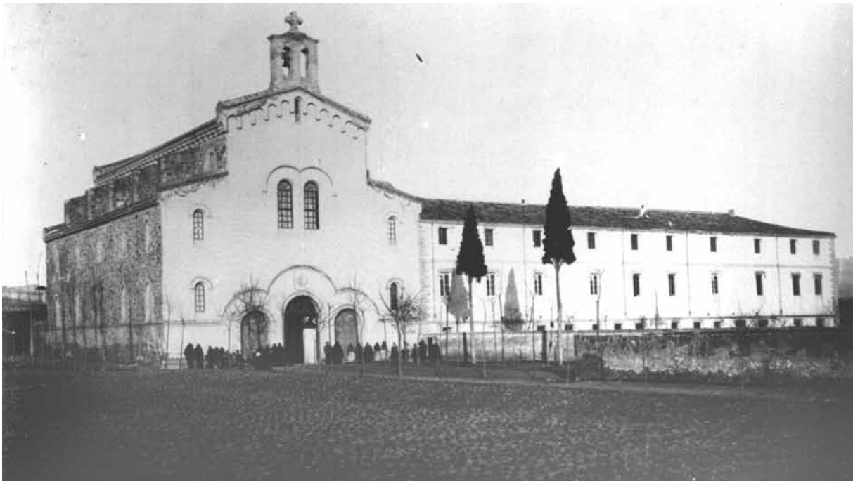
Vista de l'hospital. 1-1-1899.

per convertir-lo en hospital de pobres i així poder traslladar-hi els malats de l'antic hospital de Sant Bartomeu que es trobava en estat ruïnós, al·legant que «així ho exigeix la humanitat doliente del veïnat [...] assabentats que està vacant el convent dels caputxins, convent que té una situació còmode per a un hospital, bona i ventilada per estar fora de la vila però a prop de les muralles, amb una horta contiguous amb aigua i església». 35 Se seguiren fent diversos expedients de sol·licitud i fins al dia 3 de gener de 1842, en què es va procedir al nomenament com a administradors de l'hospital de sant Bartomeu Josep Sendra i Isidro Fàbregas. No va ser, però, fins al desembre d'aquest any que la Junta de Vendes de Béns Nacionals va cedir l'edifici per convertir-lo en hospital: «La Junta de Bienes Nacionales, usando de las facultades que le confiere el decreto de 26 de julio