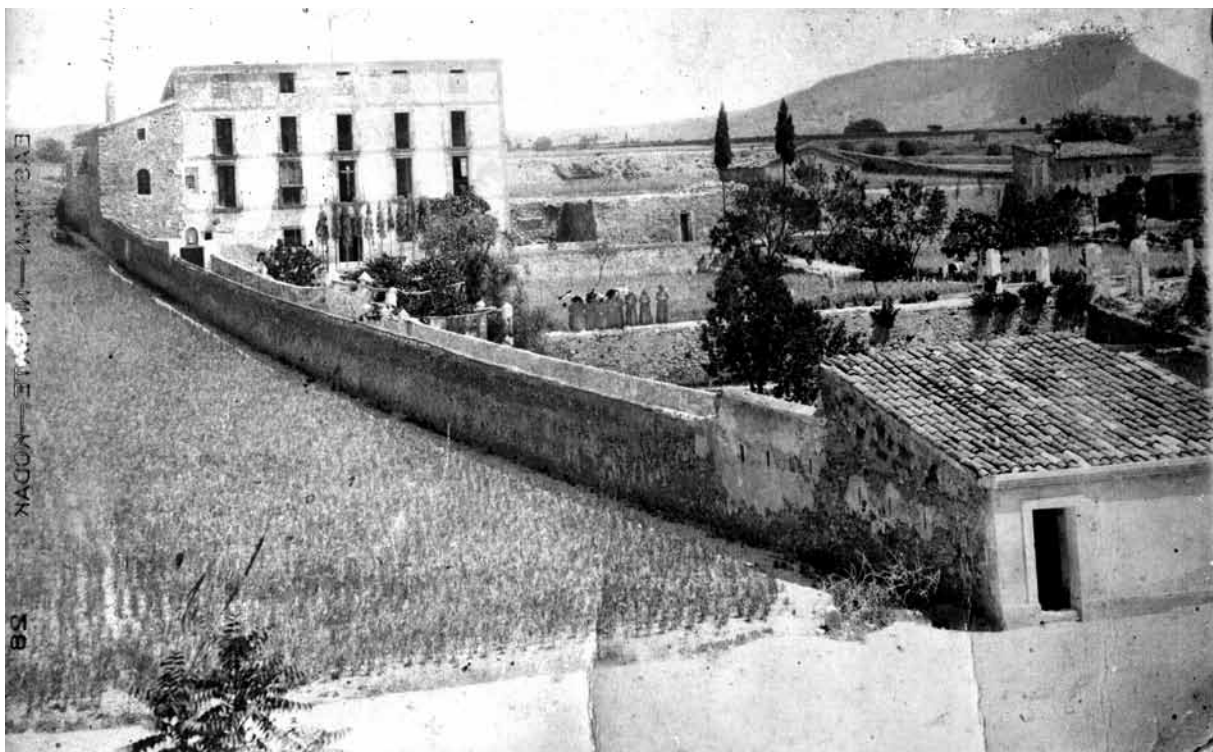
Convent dels Caputxins l'any 1882. 1.1.1882.

- S'haurà d'assegurar la casa contra incendis pagant la quantitat d'assegurances que creguin convenient.