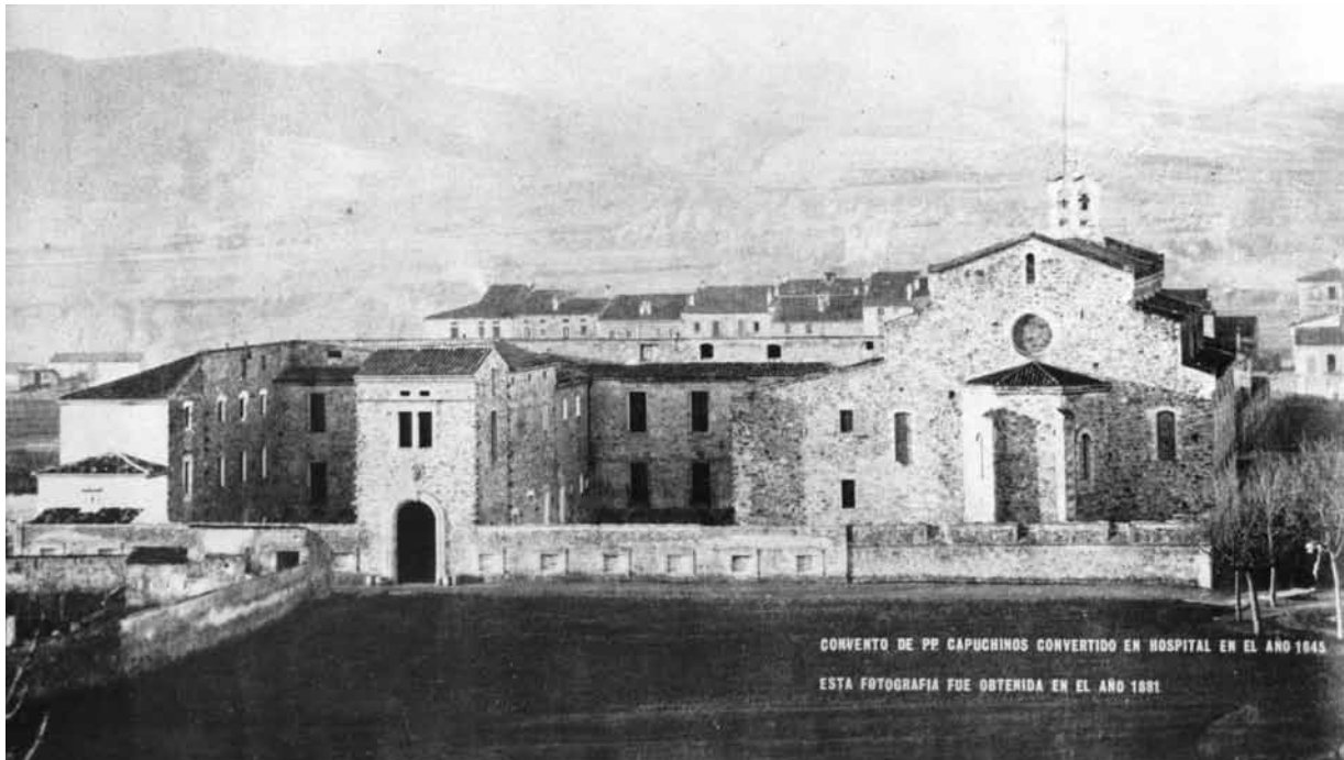
Convent dels caputxins convertit en hospital l'any 1881.