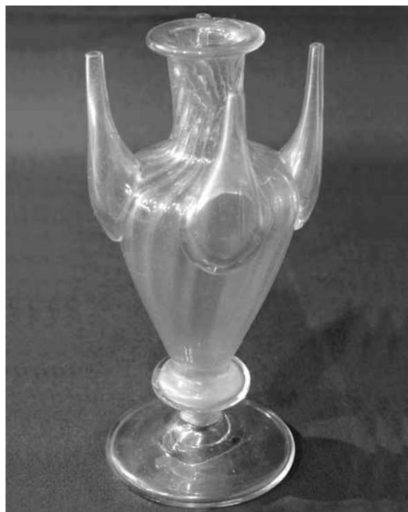
Almorratxa anoiensa de mitjan segle XIX. Vidre bufat. Col·lecció particular d'Igualada

Igualada havia tingut una confraria de joves molt potent, però a partir del segle XVII la seva importància havia decaigut molt. Per tant, calia orientar les recerques vers la Confraria del Roser per trobar-ne alguna referència històrica antiga. La notícia original, datada el 1760, es trobava al llibre de comptes de la Confraria, que actualment no sabem on para i que Gabriel Castellà degué veure poc abans de la Guerra Civil o potser poc després. En qualsevol cas, la seva Reseña histórica del Roser d'Igualada —publicada el 1973 i segurament elaborada a la postguerra pel seu estil literari general i conceptual— en fa l'anàlisi, que preferim transcriure íntegrament: 12