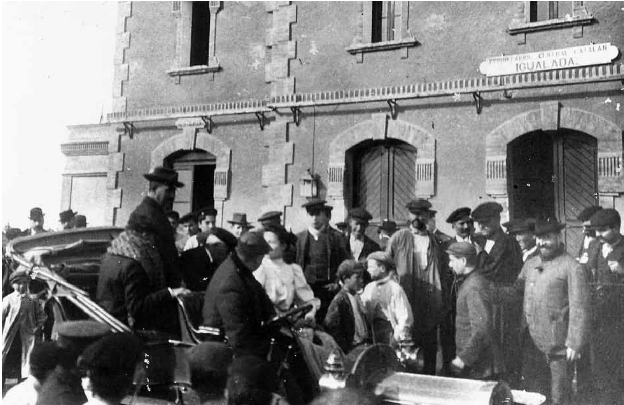
L'arribada a l'estació d'Igualada dels godonistes hostaletencs condemnats, després de sortir de la presó el 4 de novembre de 1906.

malhechores llevaban intenciones siniestras. El señor Roviralta salió, sin embargo con graves lesiones que le obligaron a guardar cama por algún tiempo».