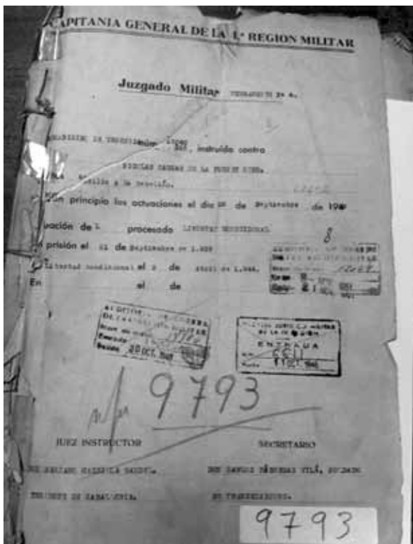
Coberta del procés contra Nicolau Casaus (1939)

a poseer cuatro ». La causa va incorporar també un informe anònim però datat a Igualada l'1-8-1939 i sens dubte redactat a la mateixa delegació de la Falange, en el qual es concretaven amb molta rotunditat diverses acusacions contra Casaus, « un individuo que su presencia por las calles causa vivo malestar en los ex-combatientes y en las personas de derechas ».