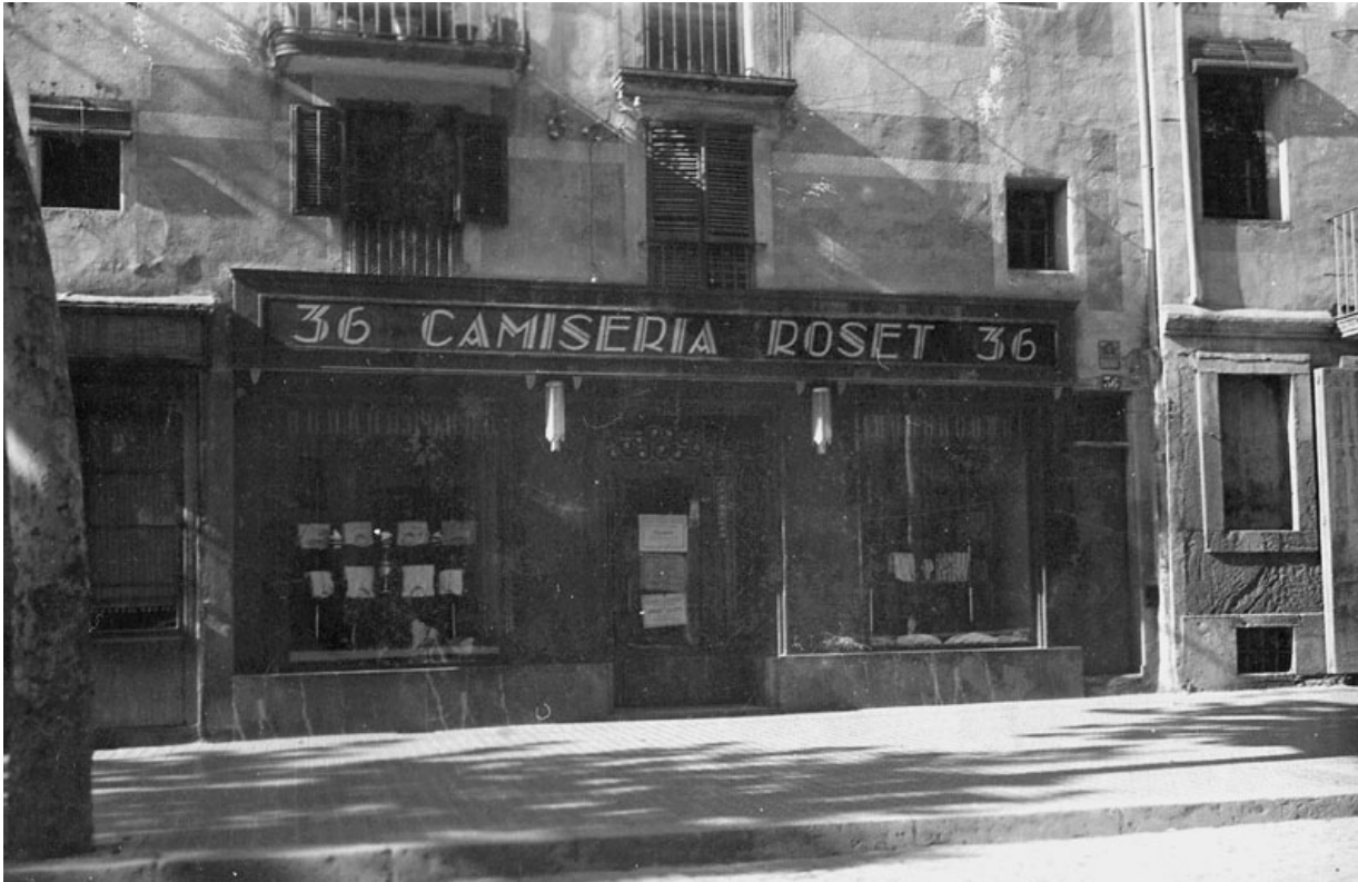
Camiseria Roset, a la Rambla de Sant Isidre, abans de la guerra