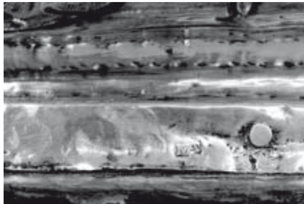
Detall de la peanya, amb el contrast o marca d'argent de Mallorca

Acabat lo reverend clero, a cinc hores, vespres i completes solemnes ab l'orgue; exposat Nostre Amo (alabat sia sempre) per la professó, luego d'arreglerada esta, ha eixit de la iglésia parroquial a un quart de sis, que luego han avisada totes les campanes del campanar, a repicons les dos mitjanes ab les dos xiques, i al vol les dos grosses [...].