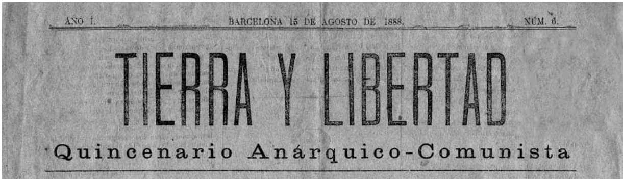
Capçalera de Tierra y Libertad , periòdic fundat el 1888.

de Trabajadores, se evita cuidadosamente aclarar el sistema económico futuro y se limitan a postular, aparte de la propiedad colectiva, “una distribución racional del producto del trabajo”. 27