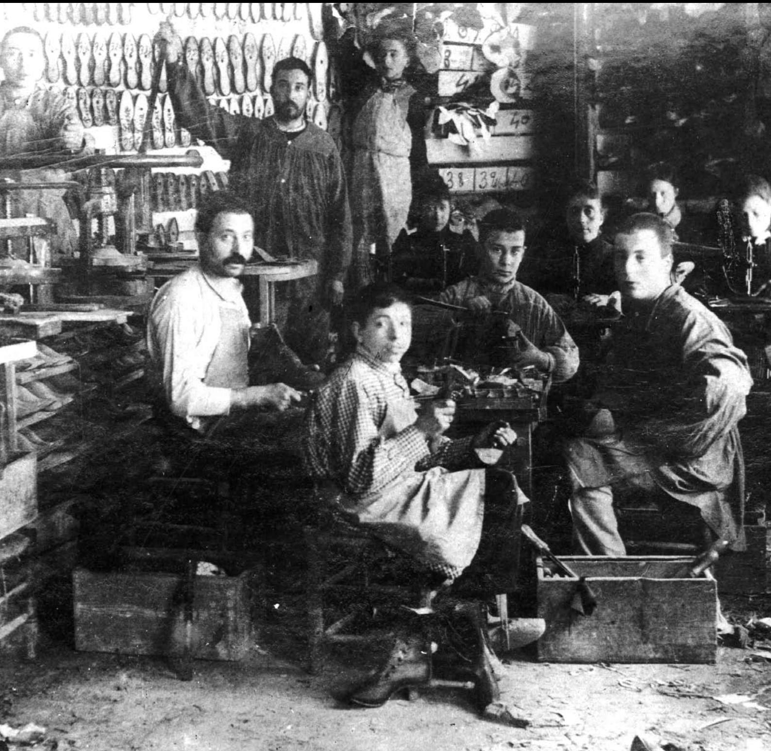
Un important taller de sabateria d'Igualada de 1890 (Cal Tonet Sabater).