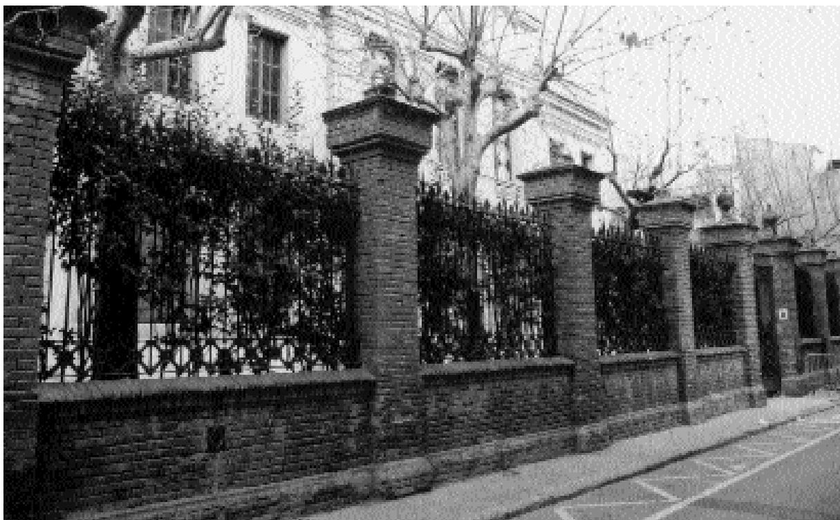
Façana de l'Ateneu