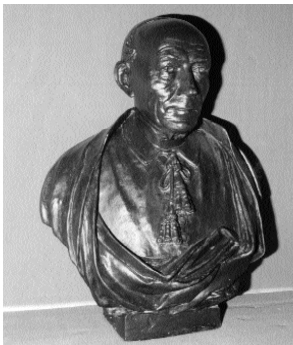
Bust del Pare Maria

Columna 3. Terra cuita. Capitell floral, fust estriat, i base àtica simplificada amb un sol torn que descansa sobre un plint poligonal. Sobre el fust es repeteix una garlanda floral subjectada per una màscara banyuda amb barba. 115 x 33 diàmetre de fust. Col·lecció familiar.