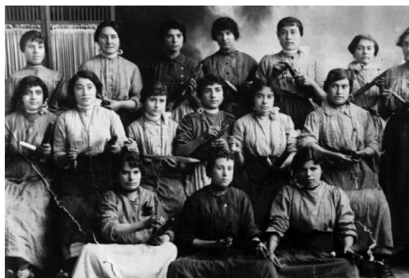
Personal de la secció d'ordidores de la fàbrica de Cal Font, any 1912.

JAUME ORTÍNEZ I VIVES (Igualada, 1950) és enginyer tècnic tèxtil. Actualment és industrial tèxtil i empleat de banca. És un dels fundadors de la Revista d'Igualada .